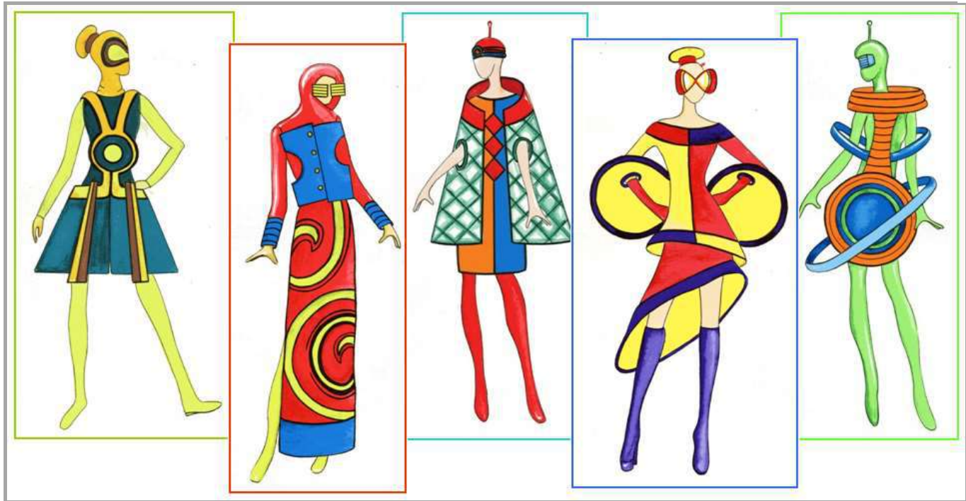
Рисунок 7 – Колекція жіночого одягу. Джерело творчості – роботи дизайнера П'єра Кардена