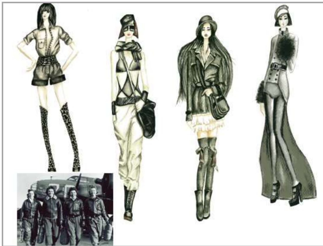
Рисунок 8 – Колекція жіночого одягу. Джерело творчості – костюми авіаторів II світової війни