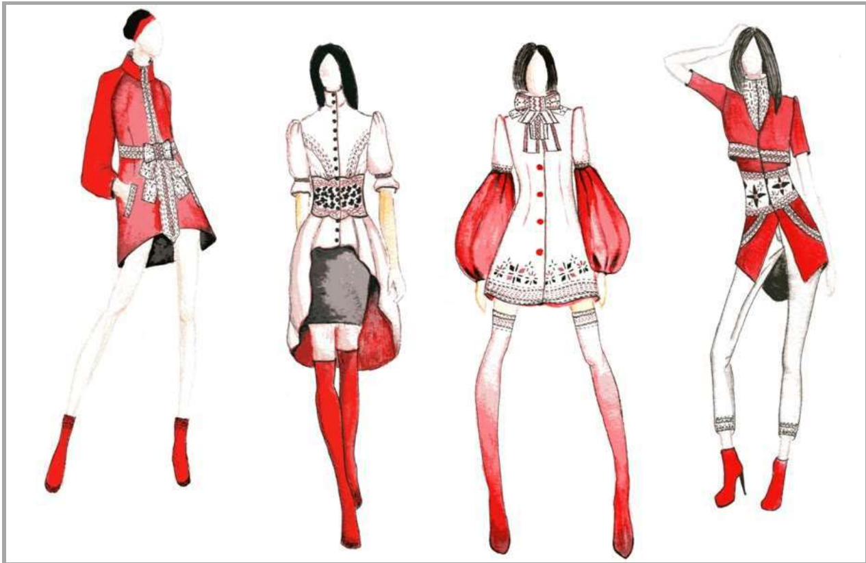
Рисунок 9 – Колекція жіночого одягу. Джерело творчості – український народний костюм