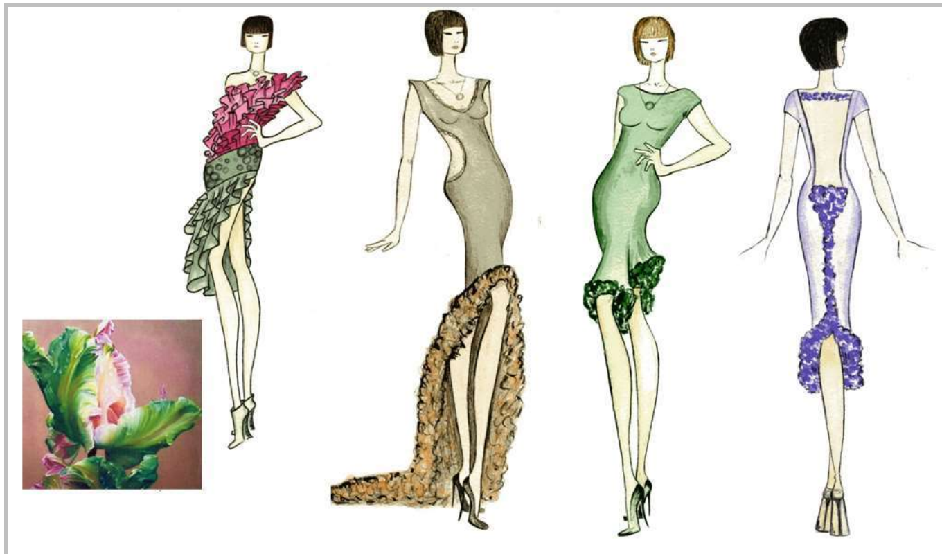
Рисунок 13 – Колекція жіночого одягу. Джерело творчості – картина «Квіти» (худ. Анна Мідлтон)