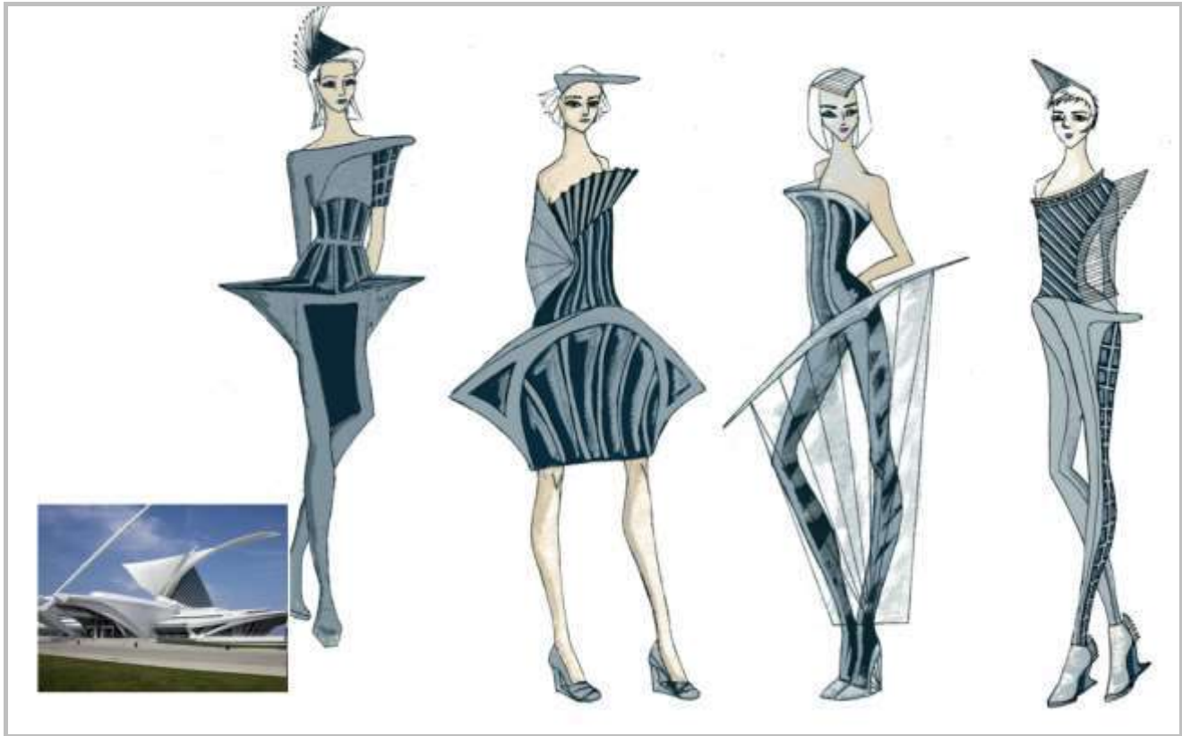
Рисунок 11 – Колекція жіночого одягу. Джерело творчості – архітектурний стиль хай-тек