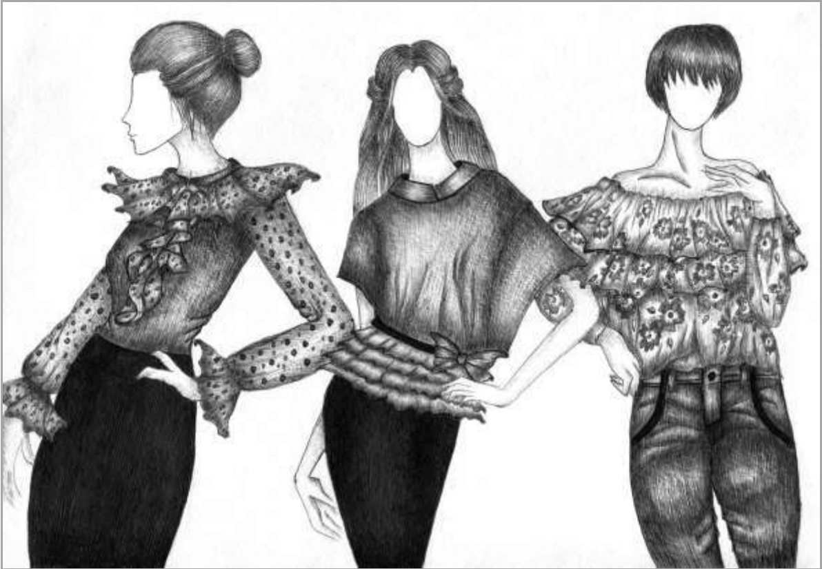
Рисунок 1 – Блузки жіночі святкового призначення в романтичному стилі