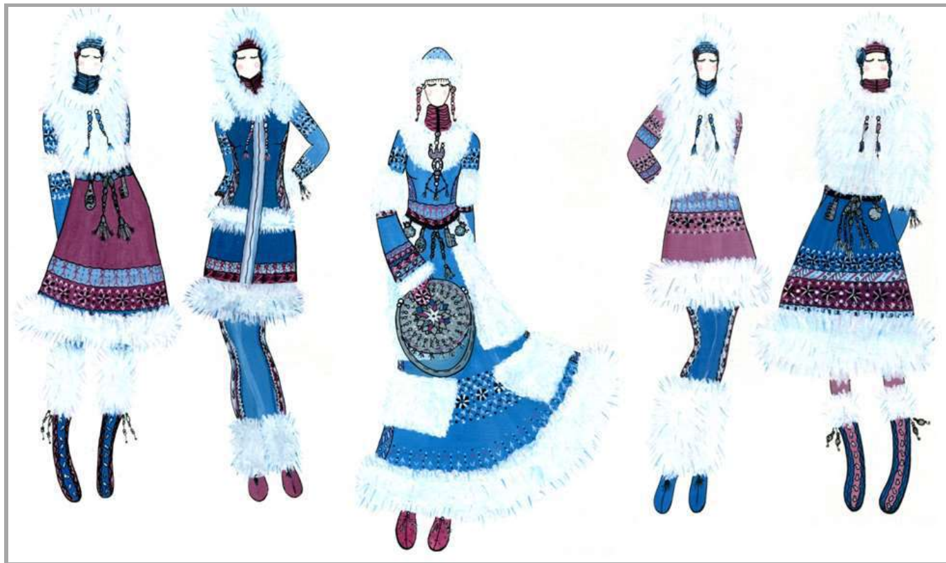
Рисунок 10 – Колекція жіночого одягу. Джерело творчості – костюм ескімосів