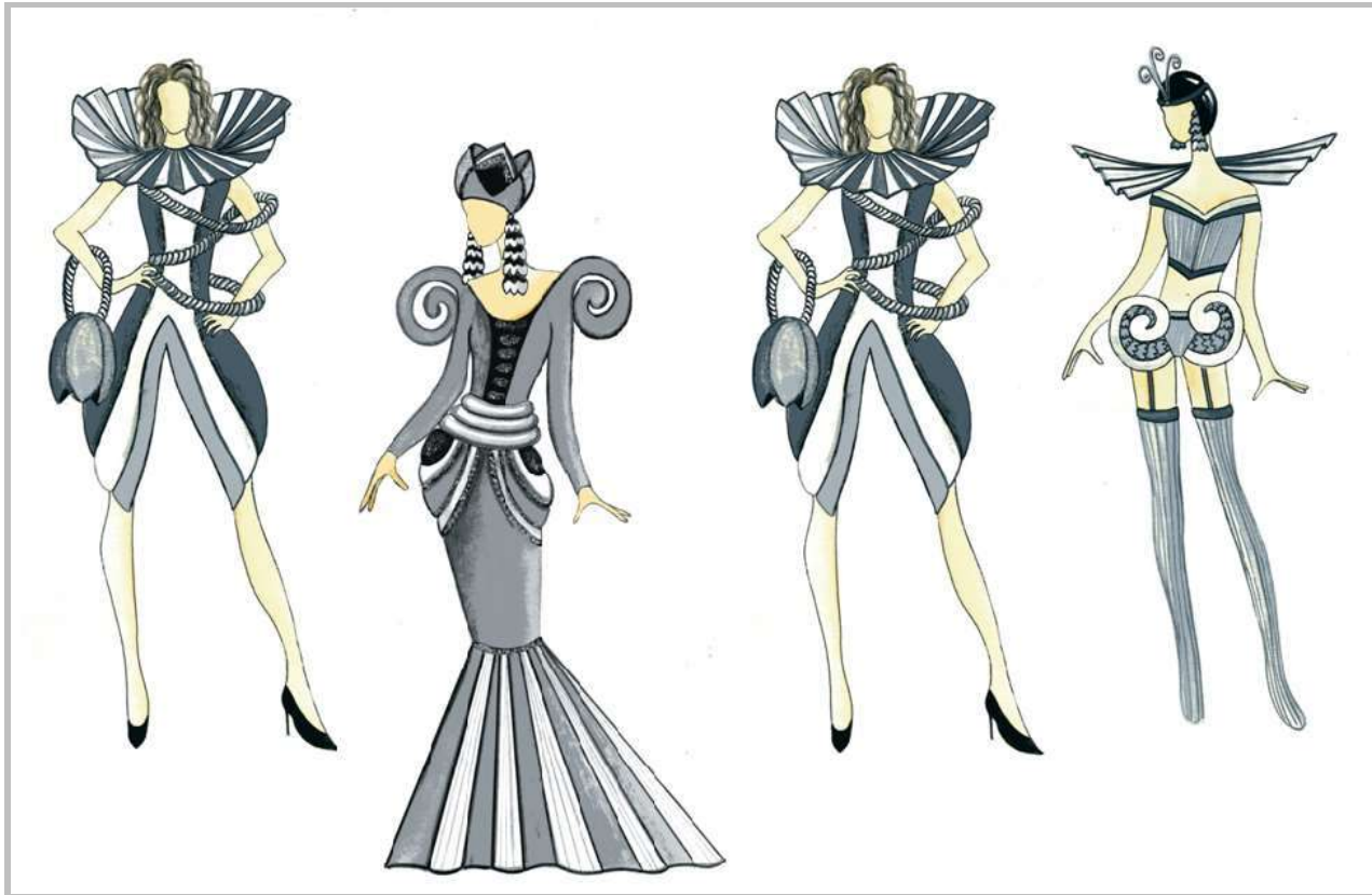
Рисунок 12 – Колекція жіночого одягу. Джерело творчості – будинок з химерами (арх. В. Городецький)