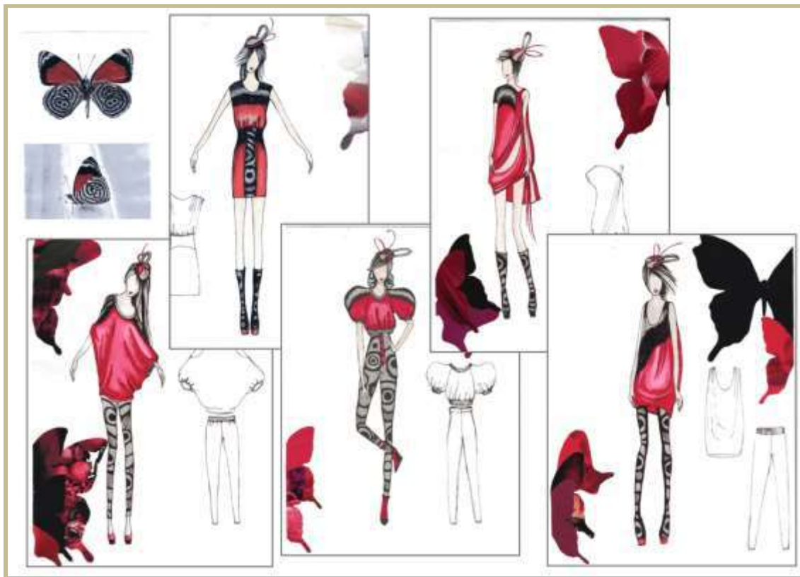
Рисунок 5 – Колекція жіночого одягу. Джерело творчості – світ комах (метелик)