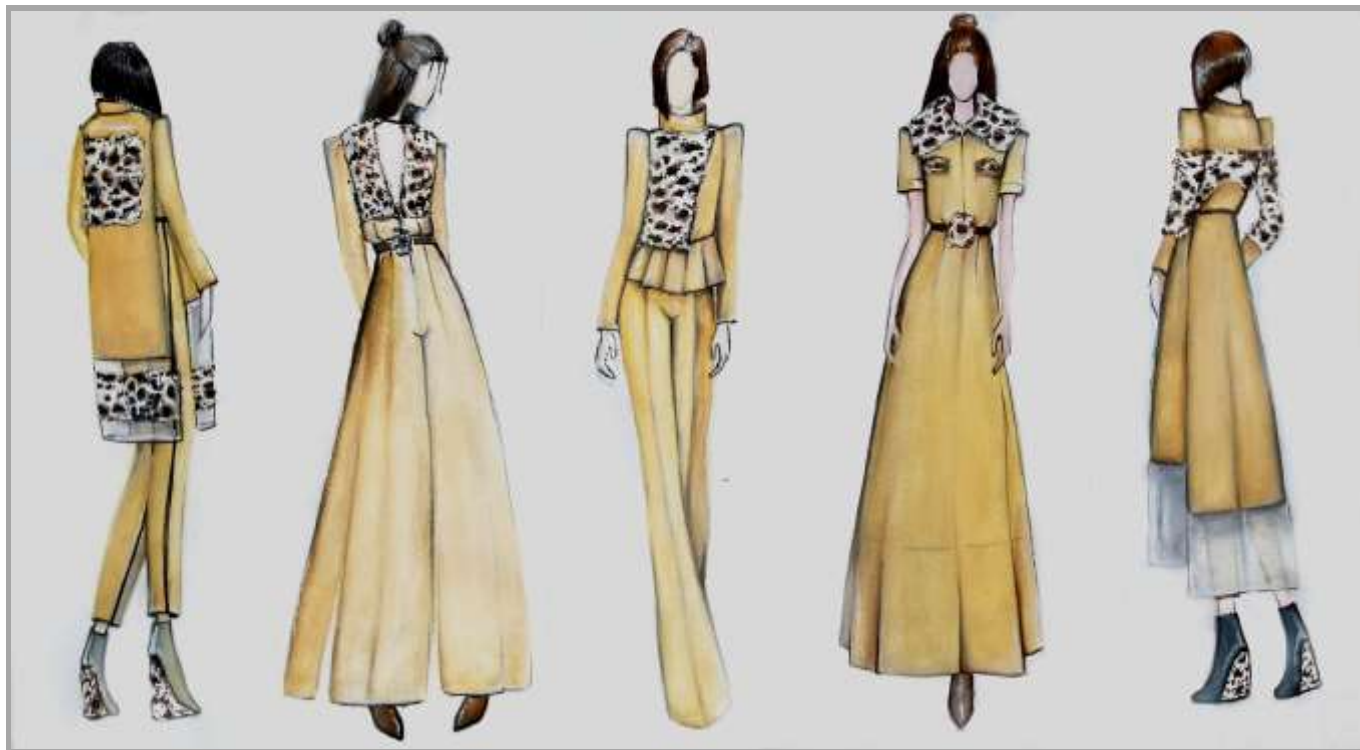
Рисунок 6 – Колекція жіночого одягу. Джерело творчості – світ тварин (леопард)