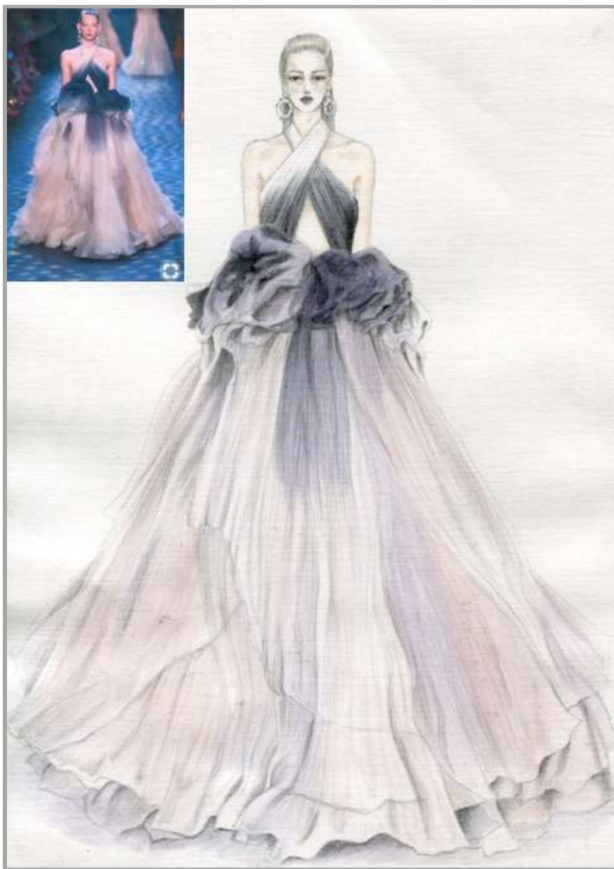
Рисунок 3 – Сукня жіноча святкового призначення