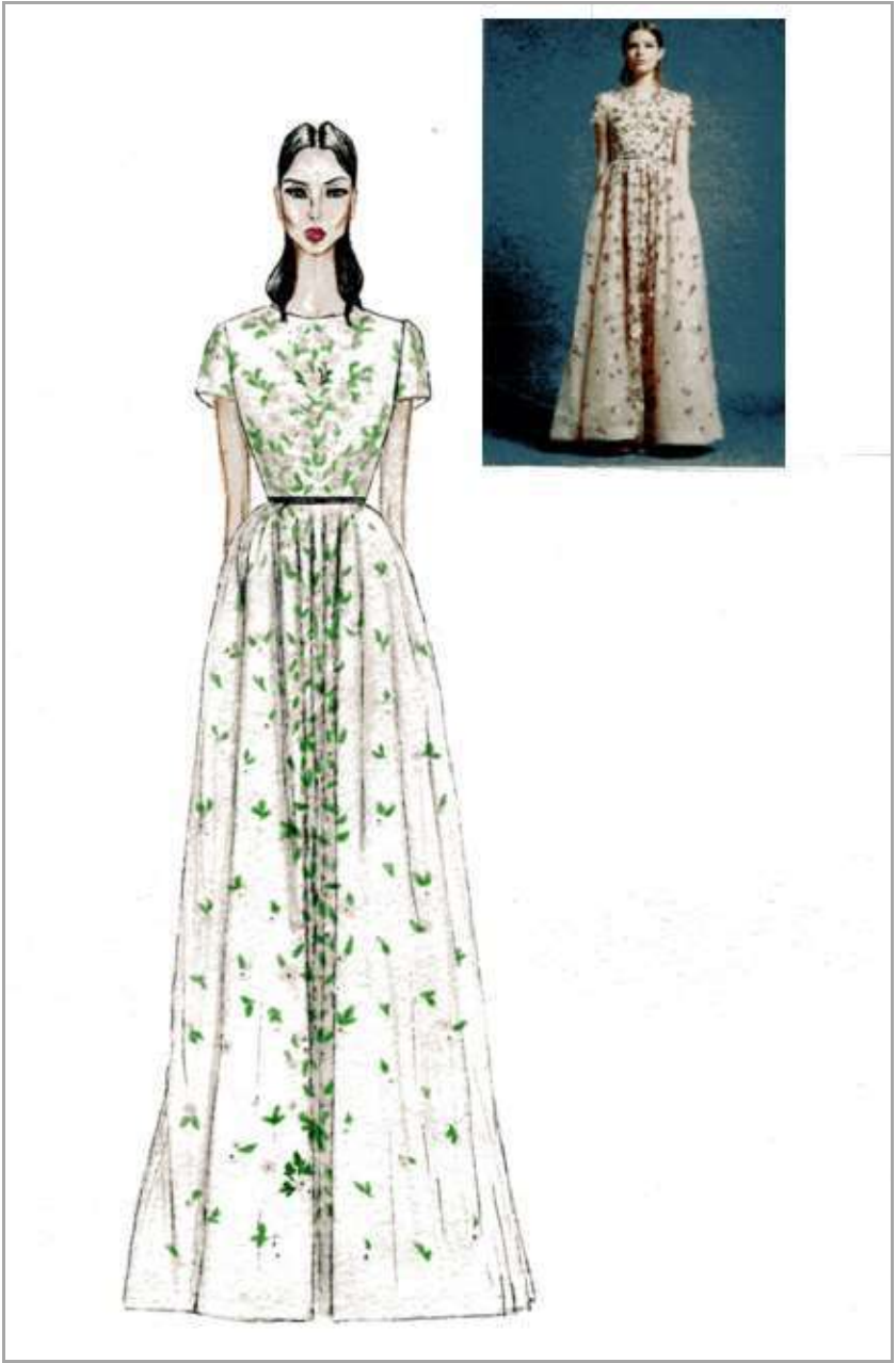
Рисунок 4 – Сукня жіноча святкового призначення