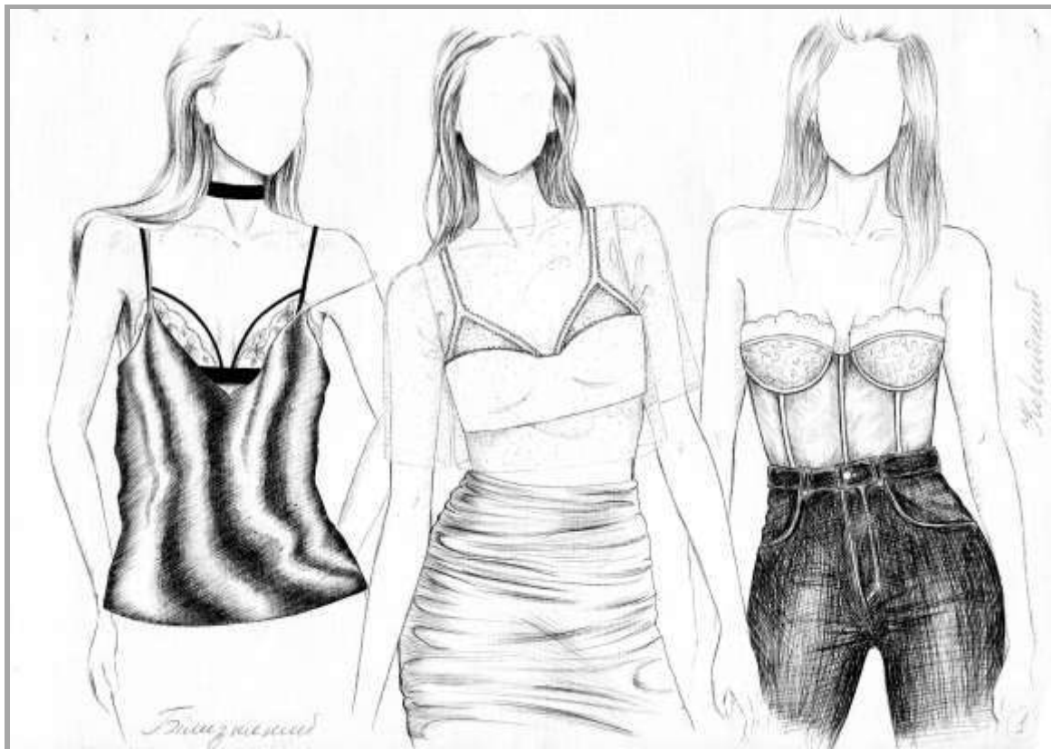
Рисунок 2 – Блузки жіночі в білизняному і корсетному стилі