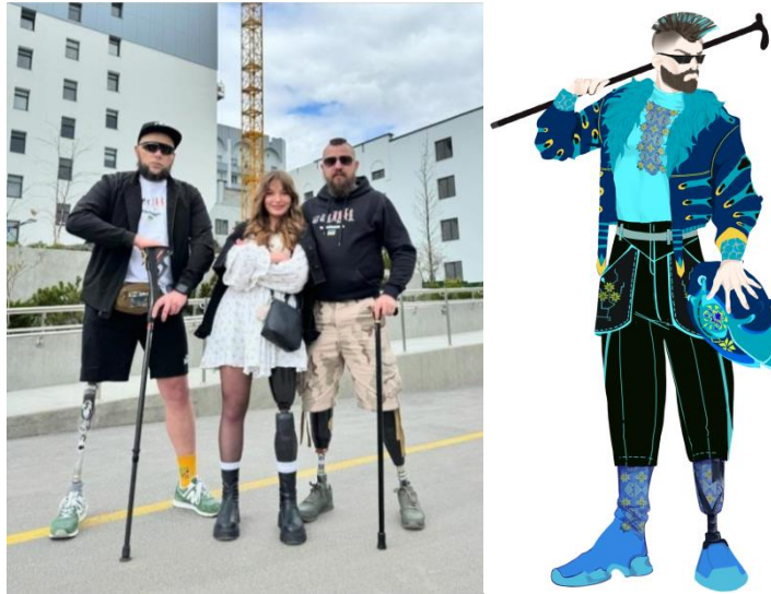
Рис. 3. Адресні споживачі і проєктний образ авторського ансамблю чоловічого одягу з колекції «Everlasting engine in our hearts»

Концепція виробів автурської колекції «Everlasting engine in our hearts» (Вічний двигун у нашому серці) полягає у наступному: нехай в серці гуркотить двигун, щоб всі знали що ми йдемо вперед. Нехай дещо змінилося, та сталевий дух не зламати нікому. Щоб не змінювалося, щоб не було, все переживемо і далі йдемо. Будь яка дорога веде до перемоги. Наш шлях простилається вибоїнами, та на тому кінці наша перемога. Двигун у нашому серці ніколи не встане.