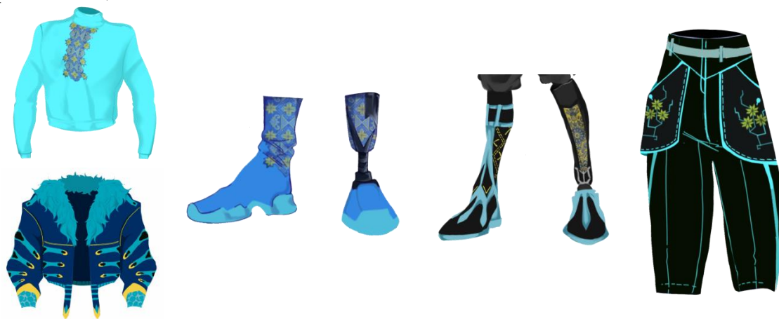
Рис. 2. Вироби та fashion-протези авторського ансамблю чоловічого одягу з колекції «Everlasting engine in our hearts»

На рис. 2, 3 представлено ряд ескізів моделей адаптивних плечових та поясних виробів в художній системі «Авторська колекція» в стилі Sport-casual під девізом «Everlasting engine in our hearts» (Вічний двигун у нашому серці) з урахуванням психофізіологічних особливостей адресного споживача. Проєктування адаптивного одягу для людей із втраченими кінцівками виконується з метою підвищення самостійності людини, створення і підтримки її фізичного і психологічного комфорту, а також забезпечення її успішної реабілітації.