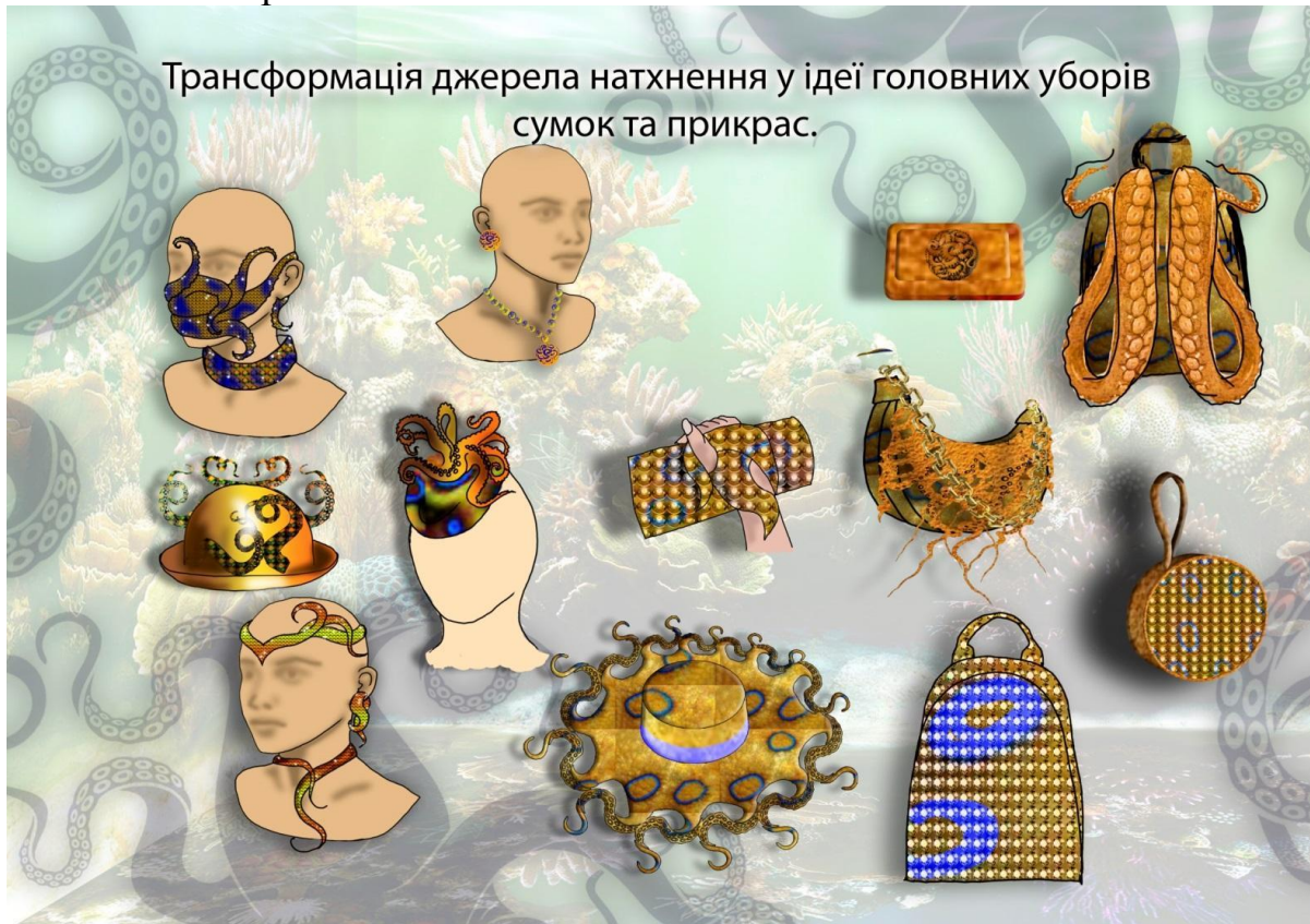
Рис. 3. Аксесуари колекції одягу «Відкрийся природній силі» (автор студ. Тітова Т.В.)

на рис. 3. В основу створення аксесуарів покладена форма та колористика джерела натхнення. Завдяки наявності аксесуарів образ колекції набув цілісності та завершеності.