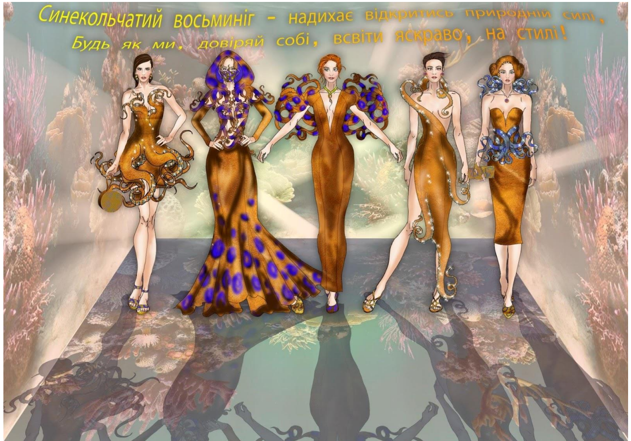
Рис. 2. Ескізний проєкт колекції одягу «Відкрийся природній силі» (автор студ. Тітова Т.В.)

На жаль у нашому світі не всі жінки наслідуються бути яскравими. Для цього треба мати внутрішню силу, впевненість у собі, незалежність від думки інших. І якщо жінка довіряє собі, своїй природній силі, вона не боїться бути яскравою та помітною, а її одяг підкреслює свободу, впевненість, сміливість та розкутість.