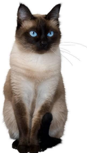
Рис.1. Джерело творчого натхнення – сіамська кішка

природну досконалість та сучасні модні тенденції.