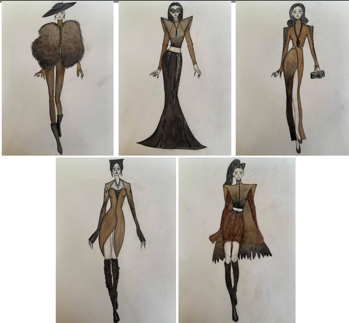
Рис.3. Ескізний проєкт колекції жіночого одягу «Грація природи» (автор Інґа Фокшек)