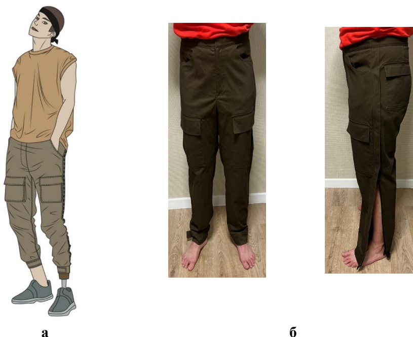
Рис. 1. Чоловічі адаптивні штани повсякденного призначення: а - художній ескіз; б - технічний ескіз; в - експериментальний зразок

Адаптивні штани повсякденного призначення призначні для чоловіків молодшої вікової групи, виготовлені з щільної бавовняної тканини. На передніх половинках розміщені кишені з відрізним бочком та накладні кишені з клапанами. На задніх половинках оброблені талієві виточки та накладні кишені з клапанами. Усі клапани мають оздоблюючу строчку (рис. 2).