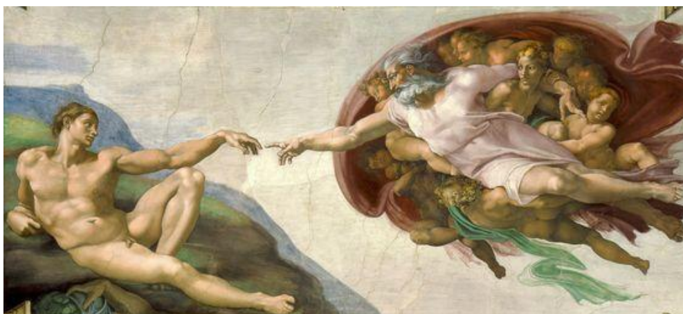
Рис. 1. Фреска Мікеланджело Буонарроті «Створення Адама» (1511-1512рр)

Фреска Мікеланджело Буонарроті на стелі Сикстинської капели (Ватикан) — «Створення Адама» (італ. La creazione di Adamo ), створена автором близько 1511-1512 років [1]. Це одна із центральних композицій, яка ілюструє створення людини Богом. Ця робота є одним із найбільш відомих творів матеріальної культури доби Відродження (рис. 1).