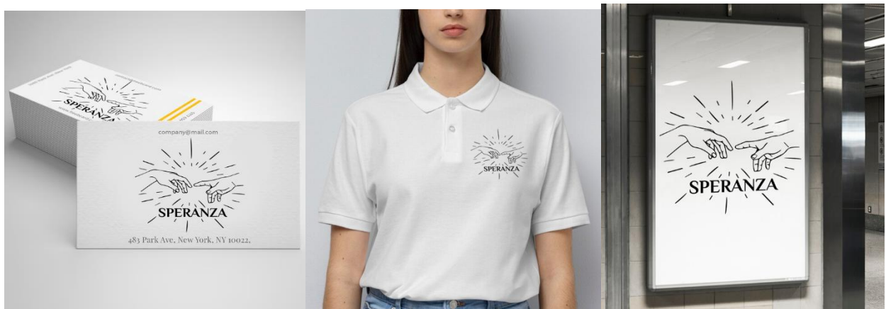
Рис. 3. Приклад використання логотипу

Пропонований дизайн логотипу є комбінованим, оскільки включає як графічний елемент, так і текстову частину. Логотип може бути використаним як в комплексі з графічним елементом та текстом, так і окремо, представляючи символ і назву бренду. Такий логотип буде доречно використовувати на візитці, уніформі, вуличній рекламі (рис.3) тощо.