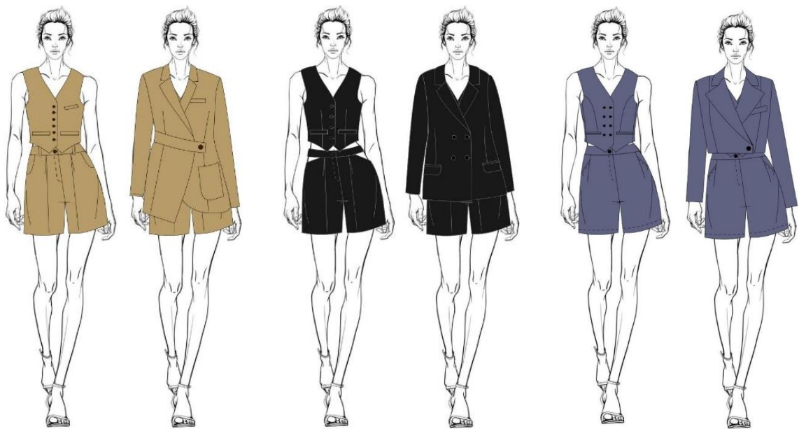
Рис. 2. Колекція жіночих комплектів у діловому стилі

За результатами дослідження була отримана інформація щодо найбільш популярних композиційно-конструктивних ознак одягу ділового стилю, яка була використана для розробки колекції жіночих комплектів (рис. 2).