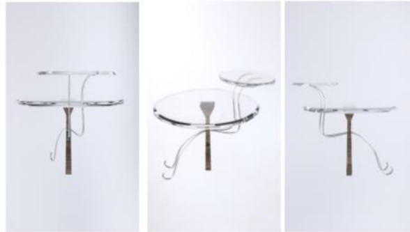
Рис.2 – Журнальний стіл. Вигляд збоку та в \frac{3}{4}

Ієрогліфи Стародавнього Єгипту служать джерелом натхнення для створення дизайну сучасних меблів. За допомогою інтерпретації ієрогліфів було створено дизайн сучасного журнального столу (рис.2).