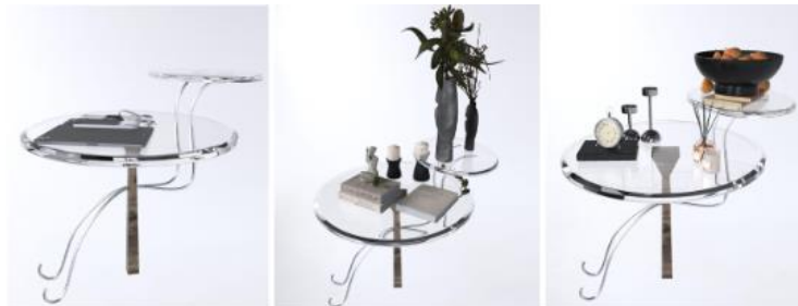
Рис.3 - Журнальний стіл з декором

Журнальний стіл (рис.2) доцільно розмістити в дизайні сучасного інтер'єру. Його можна використати для зберігання декоративних об'єктів, журналів, книг, настільних світильників, ключів тощо (рис.3).