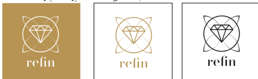
Рис. 2. Логотип на основі орнаменту Візантії

Орнамент Візантії (рис.1) надихнув на створення дизайну логотипу для ювелірної крамниці, який буде сучасною інтерпретацією матеріальної культури того часу, його можна буде легко інтерпретувати під різні носії інформації: вивіски, друковану продукцію тощо (рис.2). За основу було взято орнамент (рис.1) у якому присутні пластичні та заокруглені елементи, що передають відчуття витонченості та елегантності, що так імпонує крамниці з прикрасами – ювелірній крамниці (рис.2).