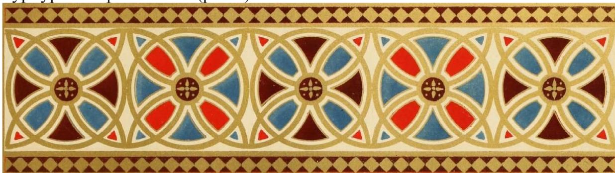
Рис. 1. Орнамент Візантії

Характерною рисою орнаменту Візантії є химерні візерунки, які сильно стилізовані. Орнаменти найчастіше представляють собою геометричні фігури у вигляді кола або багатокутника. Характерний візантійський стиль, що склався під впливом культурної спадщини інших народів, передбачає використання яскраво-червоних відтінків, а також яскраво-зелених, пурпурних і фіолетових (рис.1).