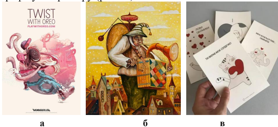
Рис. 5 – Плакатна графіка (а), книжкова (б) та станкова (в) графіка

За призначенням розрізняють станкову, книжкову, прикладну, плакатну графіку та гравюру (рис. 5).