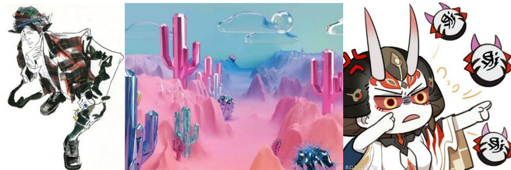
Рис. 2 – Виконання графічних творів сучасними матеріалами та інструментами: маркери, лайнери, комп'ютерні графічні 2D та 3D редактори

Поширеною в графіці є техніка гравюри (рис. 3, а) – професійний вид графіки, як друк відбитків з рисунка, вирізаного на спеціальній друкарській площині. В залежності від того, які частини дошки покриваються фарбою при друці, розрізняють опуклу і заглиблену гравюри. Специфічні особливості гравюри полягають у її тиражності, тобто в можливості одержувати певну кількість рівноцінних відбитків, а також у її своєрідній стилістиці, зв'язаної з роботою з твердими матеріалами.