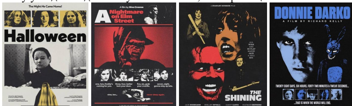
Рис. 6 – Рекламні плакати до фільмів жахів – як джерело натхнення

Сучасні графічні дизайнери мають необмежені можливості та інструменти для розробки плакатів різного призначення. Найбільш емоційно виразними є рекламні плакати і постери до фільмів, особливо, у жанрі хоррор (рис. 6). Їх художнє вирішення та емоційний вплив побудовані на використанні лише тонових і кольорових контрастів, контрастних пропорцій між розмірами елементів. У наведених прикладах, які є рекламними плакатами до фільмів-жахів 80-х років ХХ століття є особливість – їх друк на той час ще не мав такого високоякісного результату, які забезпечують сучасні друкарські можливості. Але такі візуальні «недоліки» як ефект часткового «непрокрасу», «шуму» можна вдало імітувати та використати як перевагу у поданні ідеї майбутніх плакатів, постерів з цієї тематики.