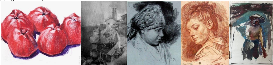
Рис. 1 – Виконання графічних творів класичними матеріалами: олівці, темпера, соус, сангіна, туш-перо, гуаш, акварель, вугіль, пастель

Термін «графіка», зазвичай, використовували щодо письма та каліграфії. Як самостійний вид зображувального мистецтва, графіка сформувалася понад три сторіччя тому. З бурхливим розвитком друкарських машин та промислової поліграфії, графіка набула звичного вигляду, в ній стали використовувати колір та різноманітні матеріали, інструменти і техніки. Соус, темпера, олівці, вугіль (пресований, деревний), сангіна, пастель (суха, масляна, воскова) – це все класичні матеріали та інструменти виконання, а до сучасних відносяться: маркери, лайнери, графічні редактори і т.д. (рис. 1-4).