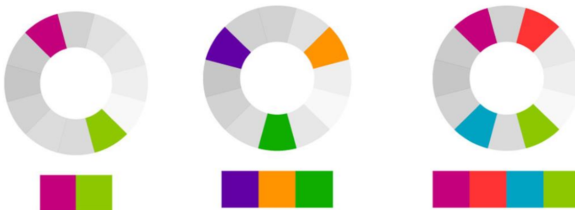
Рис. 2. Гармонії: комплементарна, тріадна, тетрадічна

Ці системи кольору добре підходять для підбору кольорів до існуючих колірних схем. Вибераючи певну гармонію треба звернути увагу на значення кольора. Кольори мають різні значення та асоціації в різних культурах і контекстах. Наприклад, у західній культурі червоний символізує любов і пристрасть. У китайській культурі, з іншого боку, це приносить удачу та багатство. Синій колір часто асоціюється зі спокоєм і