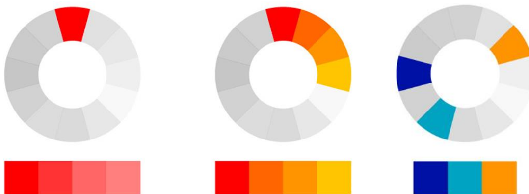
Рис. 2. Гармонії: монохроматична, аналогічна, роздільно-комплементарна