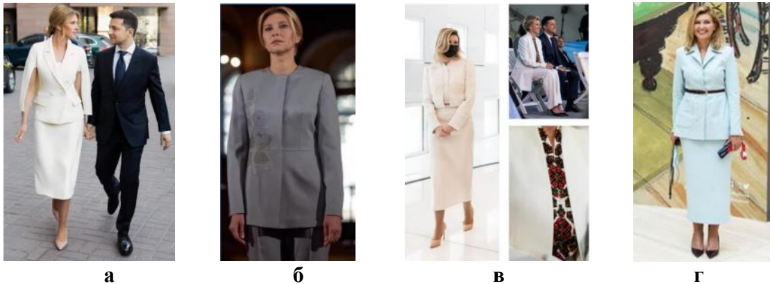
Рис. 1. Образи Олени Зеленської від українських дизайнерів: а - сукня від Артема Клімчука, 2019 рік; б - убрання від бренду Lake, 2022 рік; в - образ від Лілії Літковської, 2021 рік; г - образ від Катерини Сільченко, 2020 рік

Образи першої леді від дизайнерки Лілії Літковської запам'яталися білим костюмом із сучасного домотканого полотна, який дружина Президента обрала для офіційної подорожі до Катару, та вишитим жилетом на День вишиванки (2021) (рис.1, в). Для зустрічі з Федеральним президентом Австрії, яка відбулася біля його відомства, Олена Зеленська обрала костюм–двійку небесно–блакитного відтінку українського бренду the SOAT by Katya Silchenko (2020) (рис. 1, г). Образ перша леді доповнила чорними човниками і поясом, який зробив потрібний акцент на талії [4, 5].