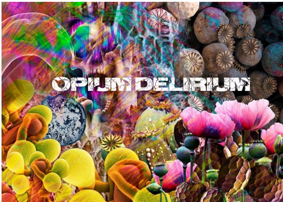
Рис. 1. Moodboard колекції «Опіумне марення»

Чималу допомогу у пошуку цікавих творчих ідей під час проєктування колекцій одягу надає дизайнеру створення Moodboard («дошки настрою»), яка віддзеркалює головну ідею проєкту. Moodboard є необхідним інструментом, що допомагає дизайнеру притримуватись основної концептуальної ідеї проєкту протягом усього процесу розроблення колекції. На рис. 1 представлено Moodboard колекції суконь «Опіумне марення».