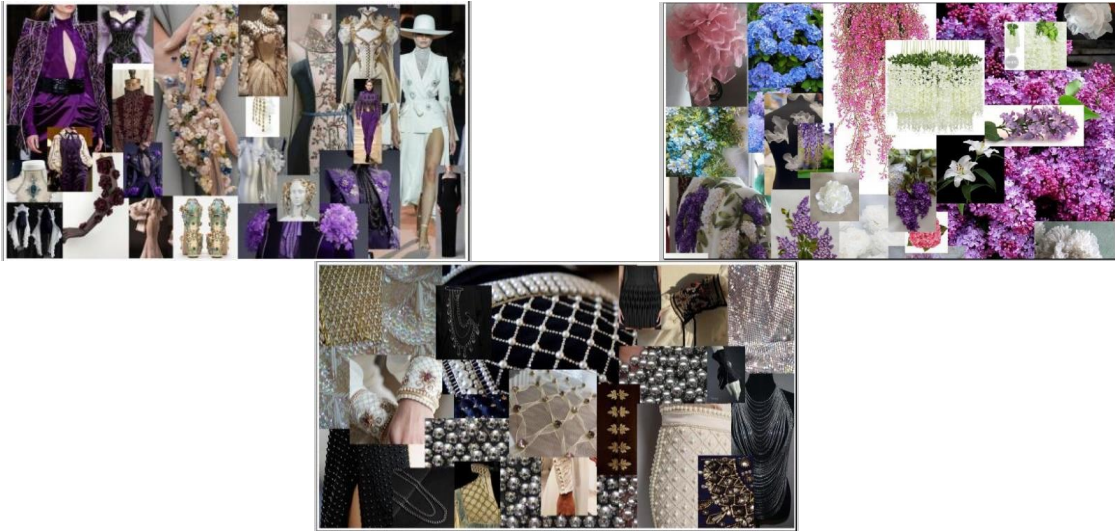
Рис. 1. Мудборти авторської колекції

Запропоновані ахроматичні ескізи авторської колекції (рис. 2) відображають низку альтернативних творчих ідей для апсайклінгу одягу, таких як: переробка вживаних речей у нові вироби чи аксесуари; використання пакувальних матеріалів для створення нових текстур; вторинне використання клаптя вживаних тканин.