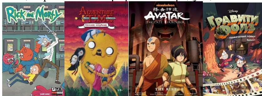
Рис. 5 – Комікси як доповнення до мультсеріалів

Тенденції в жанрах коміксів. Зараз дуже популярно використовувати комікс, як доповнення до художнього чи анімаційного фільму, до мультсеріалу (рис. 5). Але досі зберігається тенденція: спочатку створити комікс, а потім зняти за його мотивами мультсеріал чи фільм, оскільки комікс є готовим розкадруванням, по якому достатньо легко орієнтуватися для підготовки сценарію та сценографіки кінопродукції.