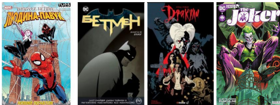
Рис. 1 – Американські комікси від Marvel та DC

Американські комікси, в більшості, є підлітковим читацьким контентом, тому основним його жанром є супергероїка – історії про всемогутніх героїв-рятівників світу та про їх неймовірні пригоди (рис. 1).