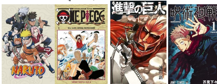
Рис. 7 – Найпопулярніші сьонени

Сьонен – жанр аніме та манги, яке розраховано на підліткову аудиторію, зазвичай саме на хлопчачу, юнацьку, тому головними героями виступають хлопці підліткового віку, щоб глядачам легше було асоціювати себе з ними і відчувати спорідненість з героям творів. Сьонен серед манга та аніме представлений такими творами як «Наруто», «One Piece», «Атака титанів», «Магічна битва» (рис. 7).