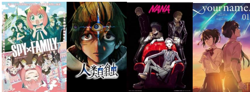
Рис. 3 – Японські комікси – манга

Стилістика азіатських коміксів має свої особливості: в першу чергу, змінені пропорції рис обличчя (які подібні до котячої мордочки: великі очі, маленький носик, підборіддя) та частин тіла, експресивна міміка. Часто манга дуже динамічна, оскільки має багато бойових сцен, особливо, якщо історія виконана в жанрі «сьонен», часто використовуються різні ракурси і карколомні повороти, навіть у простих діалогах. Вони є дешевими у виробництві звичайними коміксами, читаються справа-наліво, виконані в чорно-білій графіці.