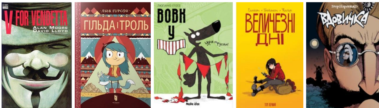
Рис. 2 – Європейські комікси

Європейські комікси мають серйозний та провокативний характер: реальні злочинні теми та політична сатира – це особливо притаманне британським коміксам, наприклад «V – значить Вендетта» Алана Мура. Є також комікси з більш розважальним змістом – франко-бельгійська школа коміксу. Однак, це не означає, що вони є «дитячими» та «беззубими», такі комікси теж можуть мати глибокий психологізм та філософію, наприклад, «Гільда» Люка Пірсона.