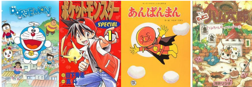
Рис. 6 – Найпопулярніші кодомо

В манга найпопулярнішими є представники жанри кодомо та сьонен. Кодомо – це метажанр аніме та манги, який призначений для дитячої аудиторії, в ньому мало жорстокості та багато спрощення і глибокої стилізації як ідеї змісту, так і персонажів (рис. 6). До кодомо належать загальновідомі аніме «Покемони», «Дораемон», «Анпанмен», «Хамтаро».