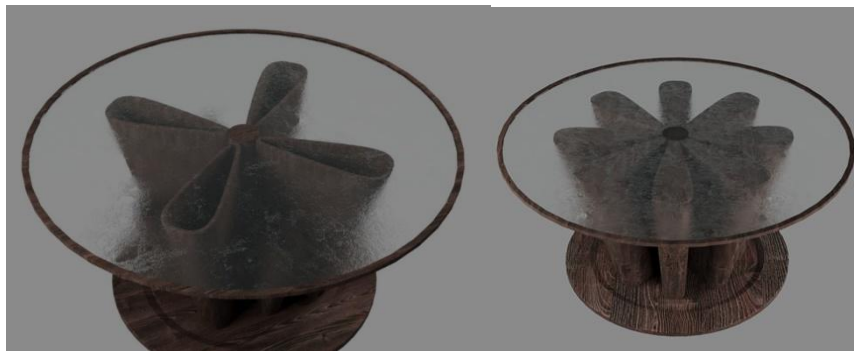
Рис. 3. Варіанти журнального столу. Вигляд в 3/4

Середня частина журнального столу є інтерпретацією геометричного орнаменту стародавньої Месопотамії, а саме багатопелюсткової квітки або зірка, символу богині Іштар, та краще проглядається на рисунку 3.