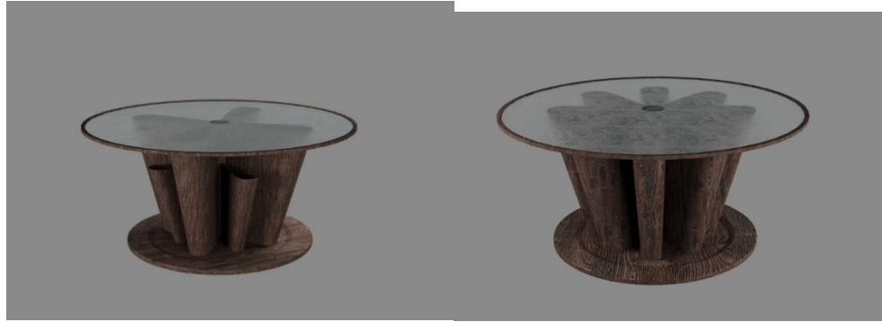
Рис. 2. Варіанти журнального столу. Вигляд збоку

Середня частина журнального столу є інтерпретацією геометричного орнаменту стародавньої Месопотамії, а саме багатопелюсткової квітки або зірка, символу богині Іштар, та краще проглядається на рисунку 3.