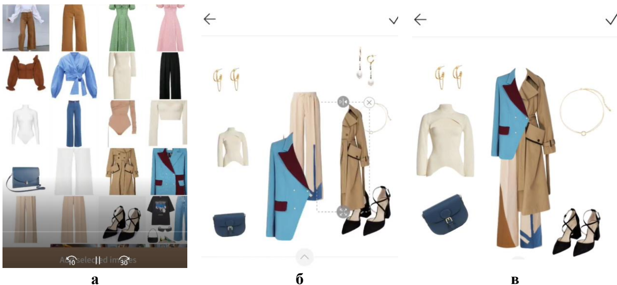
Рис. 2. Візуалізація процесу розробки авторського ансамблю одягу: а) вибір елементів із цифрової шафи; б) складання моделі, в) перегляд готових моделей

Створення нової моделі одягу з використанням мобільних додатків дозволяє швидко створити не лише віртуальну модель одягу, а й завершити образ різними доповненнями і аксесуарами, створити колаж.