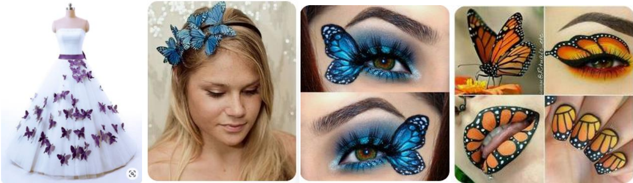
Рис. 2. Використання метеликів в створенні модного луку

Технологія виготовлення прикрас з пластикових пляшок не є складною, але вимагає багато терпіння, часу та акуратності. Загальний зміст роботи полягає в наступному: на поверхню пляшки наносять контурний малюнок, а потім розписують вітражними фарбами або лаком для нігтів і декорують блискітками, пайетками та іншими дрібними деталями.