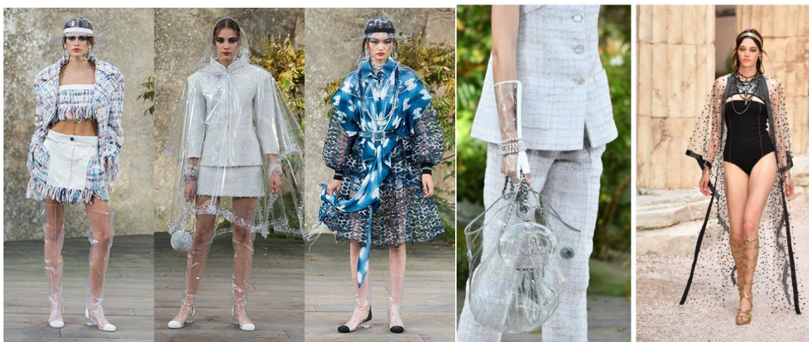
Рис. 1. Моделі одягу, розроблені з використанням пластикових відходів

Сьогодні ряд дизайнерів здійснюють розробку оригінальних моделей одягу з використанням таких нетрадиційних матеріалів як: поліетиленові пакети та пляшки (рис. 1), фольга, папір, картон, агроволокно, пластикові сітки, синтепон. Студентська молодь теж долучається до поширення цього тренду при розробці нових моделей одягу [1].