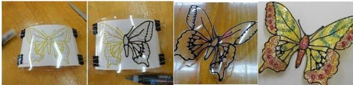
Рис. 5. Етапи виготовлення метелика з пластикової пляшки

скріпками. Контур об'єкту наносять перманентним маркером або контуром (який є у наборі фарб для вітражів) і дають час на висихання. Розфарбування поверхні виконують на вирізаному об'єкті або на цілій пляшці. Поверх фарби наносять лак для нігтів – прозорий або з блискітками. Вирізають метелика за допомогою ножиць для паперу до або після розфарбовування. Прикрашають тулуб та крильця намистинами. В тулубі шилом роблять отвори для голки, щоб готовий декор можна було пришити до сукні (рис. 5) [5, 6].