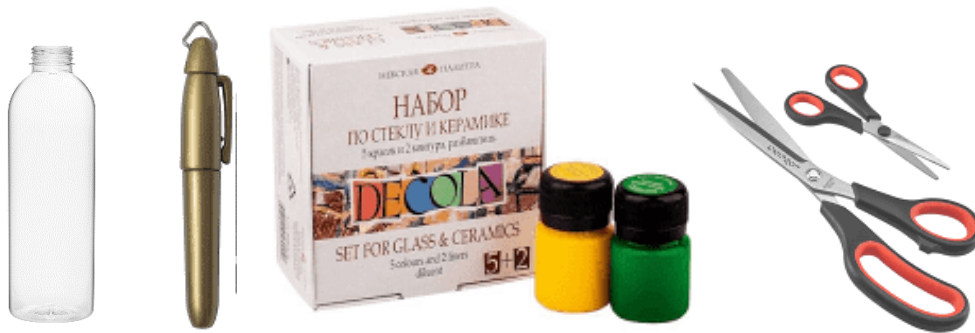
Рис. 3. Набір матеріалів та інструментів для роботи

Перед роботою готують необхідні матеріали та інструменти (рис. 3). Виготовлення можна здійснювати декількома способами, які відрізняються послідовністю дій, а також використовуваними матеріалами [5].