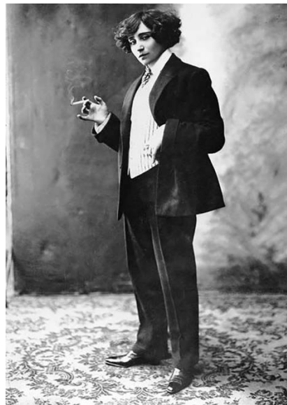
Рис. 1. Жорж Санд – королева французького романтизму

Стиль гарсон – жіночий стиль одягу, який полягає у використанні чоловічого гардеробу [2]. Його засновником вважають Амандину Аврору Люсіль Дюпен. Втім, набагато більше ця особа відома як Жорж Санд: переселившись до Парижа в 1831 році, молода літераторка почала носити не тільки чоловічий псевдонім, а й вбрання. Таким чином вона стверджувала себе у світі, яким повністю розпоряджалися чоловіки. Суспільству, однак, знадобилося майже сторіччя, щоб прийняти і ухвалити ініціативу, запропоновану Жорж Санд. А саме образ чуттєвої красуні, окреслений строгими лініями чоловічого одягу (рис. 1).