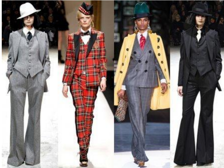
Рис. 4. Сучасні моделі одягу в стилі гарсон

Акcesуари мають бути витримані в класичному суворому стилі. З головних уборів можуть бути циліндри або казанки, обов'язково однотонні, без зайвих деталей. Ремені бажано вибирати з хорошого матеріалу, щоб не здешевити образ. А ось краватку можна вибрати будь-яку, навіть у смужку, горошок [2].