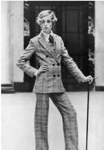
Рис. 2. Британська модель Твіггі

Повчитися носити одяг «з чоловічого плеча» варто, перш за все, у Габріель Шанель. Це вона, вловивши жіночу потребу в чоловічих предметах гардеробу, перетворила її на тренд. Шанель мала ідеальну для нового стилю статуру: «єгипетські» плечі, довгі ноги і маленькі груди. Створивши одяг, перш за все, для себе, Шанель стала орієнтиром для мільйонів інших жінок. Серед цих жінок варто згадати Едіт Піаф, яка дуже часто виступала в білому смокінгу та чоловічому капелюсі, а також її близьку подругу Марлен Дітріх, зірок чорно-білого екрану Грету Гарбо та Кетрін Хепберн (рис. 3).