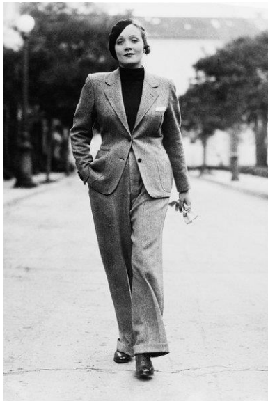
Рис. 3. Зірки Голівуду Марлен Дітріх та Кетрін Хепберн