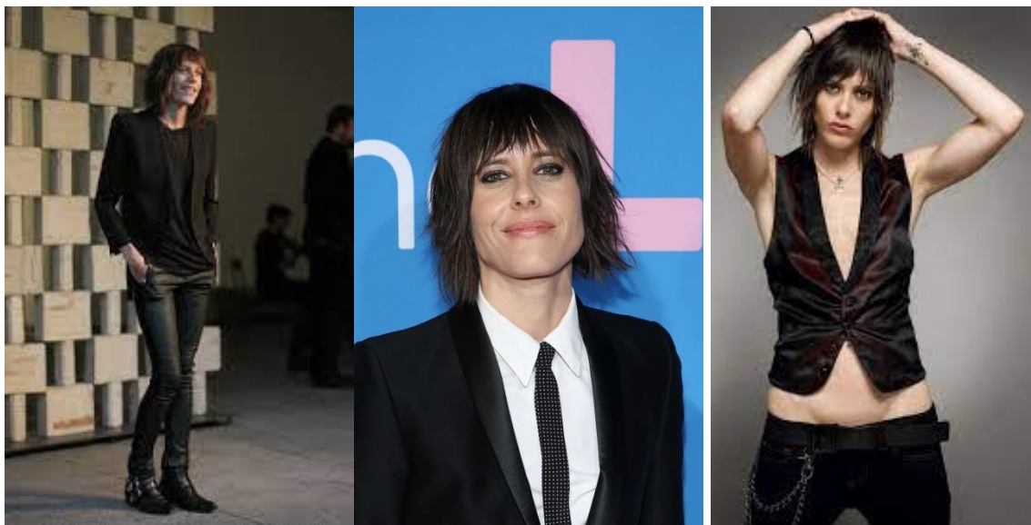
Рис. 5. Кетрін Менінг – популяризаторка стилю гарсон

На сьогодні американка Кетрін Менінг може вважатися сучасною іконою стилю гарсон. Актриса регулярно з'являється на різноманітних зустрічах в оригінальних образах. Кетрін не боїться експериментувати з образами, тому сміливо вносить в стиль власні корективи: поєднує класичні сорочки і піджаки з джинсами і шкіряними штанами, замінює сорочку футболкою, також використовує яскраво-червоні підтяжки і навіть одягає жилетку на голе тіло. При цьому виглядає незвичайно і дуже цікаво (рис. 5).