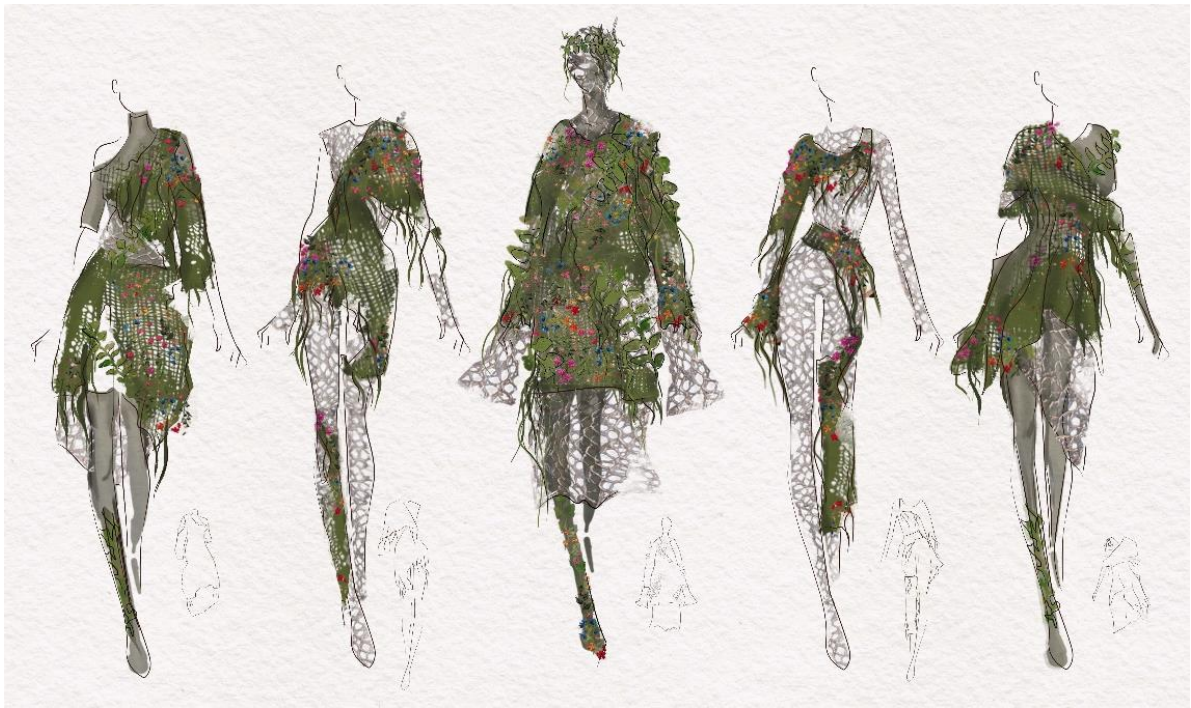
Рис. 4. Авангардна колекція «Матінка-Природа»