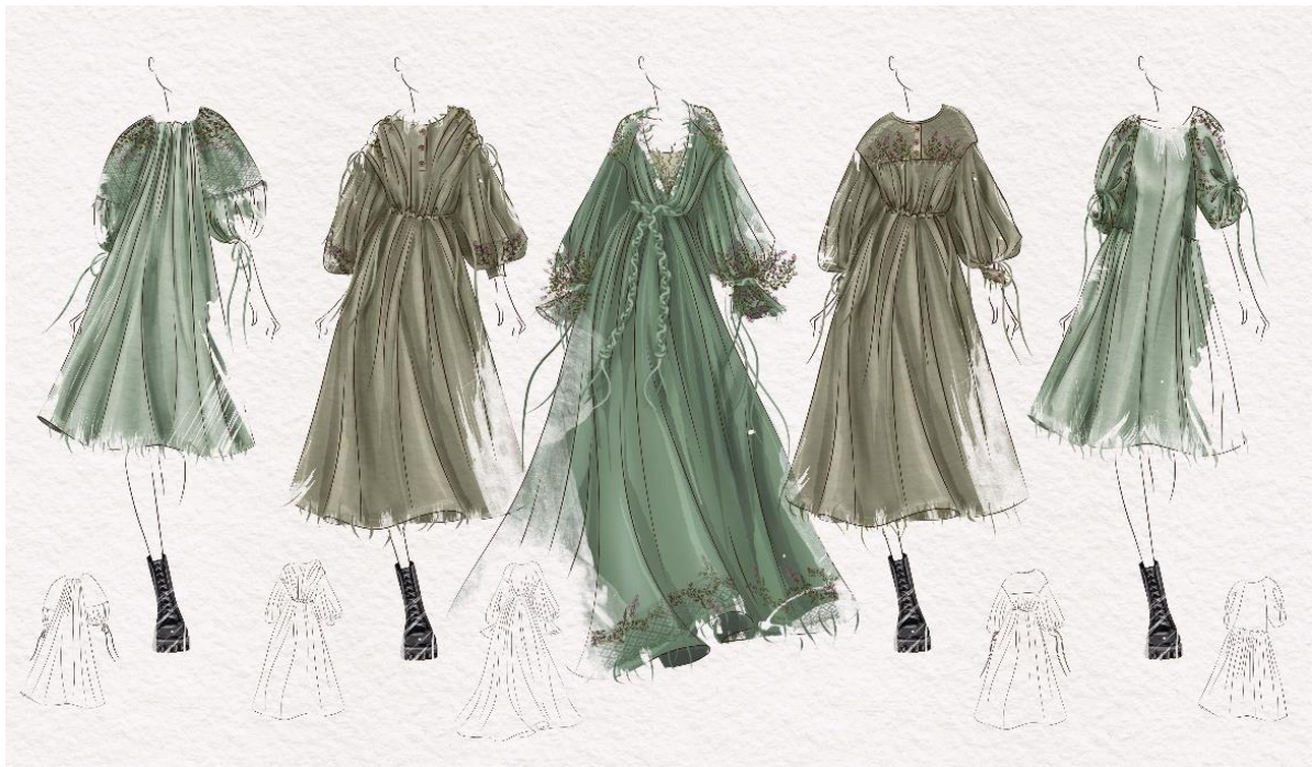
Рис. 2. Промислова колекція «Польовий шепіт»

Основним матеріалом передбачено натуральний тонкий льон природних трав'янистих відтінків із невеликим вмістом синтетичних волокон. Особливістю даної колекції є технологія декорування виробів тонким в'язаним мереживом ручної роботи, поверх якого наноситься вишивка на основі рослинних мотивів. В колекції також пропонується застосування необроблених країв деталей, а саме: низу рукава, сукні, горловини виробу.