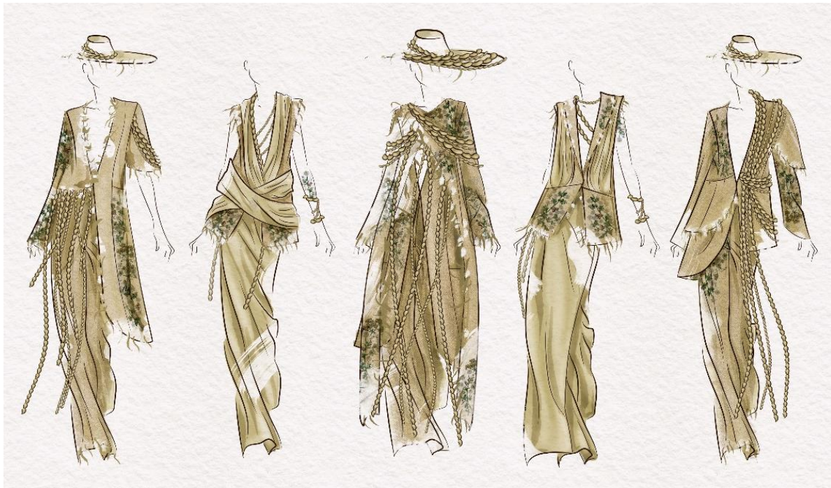
Рис. 3. Перспективна колекція «Вільний мандрівник»

Основний матеріал даної колекції – цупка бавовняна (для створення жорсткіших форм жакетів, жилетів, штанів) та легка шовкова тканина (для додання легкості та таємничості образу).