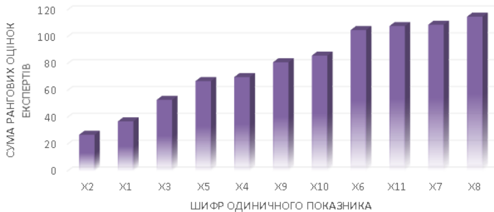
Рис. 4. Априорна діаграма рангів

Априорна діаграма рангів показує, що найменші значення суми рангових оцінок експертів мають такі показники як X1-5, що і є найбільш вагомими для ансамблю жіночого одягу сценічного призначення. Далі властивості розміщено у порядку спадання їхньої вагомості.