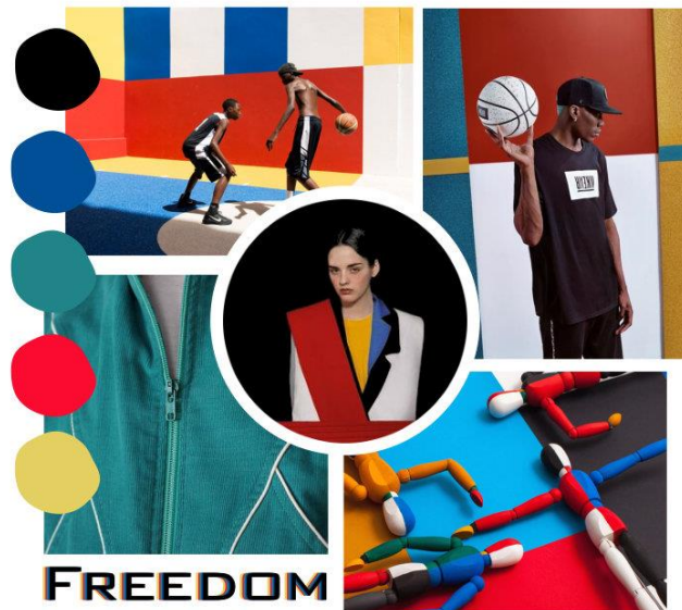
Рис. 3. Мудборд для ансамблів жіночого одягу

Кольорові блоки, форми, лінії членувань і деталей ритмічно повторюються в кожній моделі, сприяючи розвитку авторської ідеї. При цьому домінуючими в колекції є форма і колір, що відповідає основним принципам супрематизму Малевича.