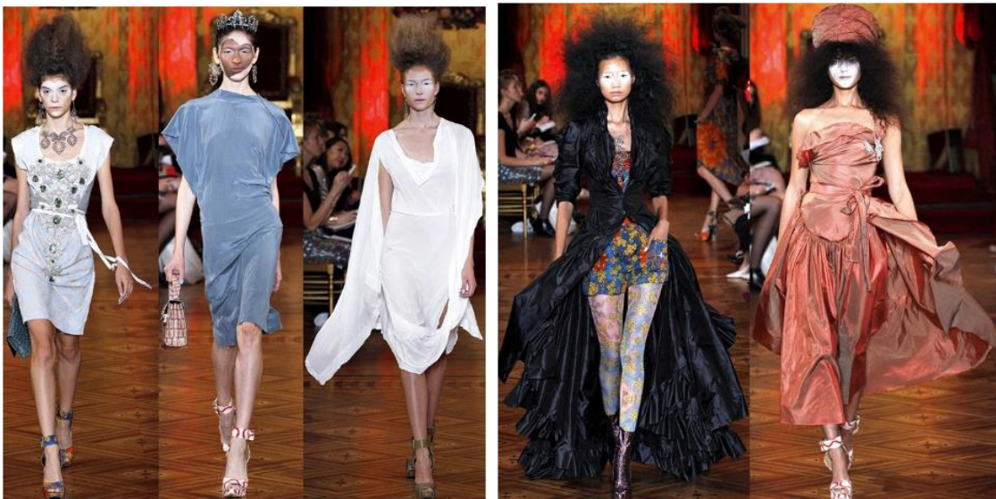
Рис. 1. Колекція Vivienne Westwood весна-літо 2013[]

Часто модні образи в руслі еkleктизму створюють, ґрунтуючись на рисах і властивостях певних джерел натхнення, зокрема історичних і художніх стилів, національних традицій і сучасного мистецтва. Зокрема, дизайнерка Вів'єн Вествуд, культивуючи еkleктизм у всіх своїх колекціях, використовує прекрасні, пишні костюми стилів бароко і рококо, створюючи тим самим моделі не просто розкішні, а надрозкішні й екстравагантні, багаті поєднаннями різних форм, матеріалів, химерних деталей [1, 2] (рис. 1).