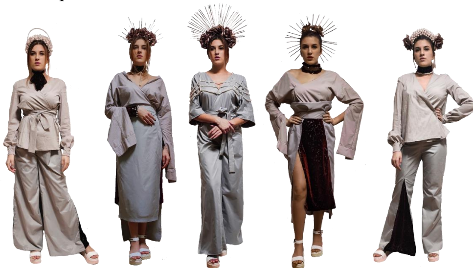
Рис. 5. Виготовлена в матеріалі колекція одягу під девізом «Look again, think again»

Стилiзовані форми японського костюма було трансформовано в сучасні форми сорочок, спідниць і штанів колекції. Історичний стиль бароко інтегровано в моделі колекції у вигляді аксесуарів, фактур і рисунку матеріалів (рис. 5). Головним композиційним елементом розробленої колекції є оздоблення, головним засобом зв'язку – контраст, головним композиційним принципом – виразність.