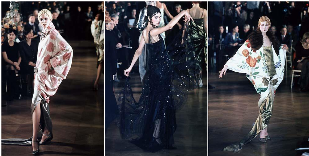
Рис. 3. Колекція Дж. Гальяно в «ретро» стилі

Модельєр Джон Гальяно, в своїй творчій діяльності також часто звертався до історичних і національних мотивів, створюючи при цьому яскраві, часто шокуючі, сучасні образи (рис. 3).