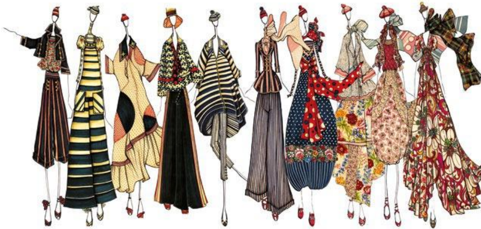
Рис. 2. Ескізи колекції одягу японського модельєра Т.Кензо

Модельєр Джон Гальяно, в своїй творчій діяльності також часто звертався до історичних і національних мотивів, створюючи при цьому яскраві, часто шокуючі, сучасні образи (рис. 3).