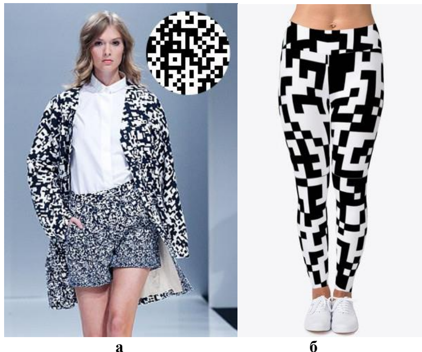
Рис. 1. Нанесення мотивів QR-кодів на поверхню одягу: а) жіночий костюм; б) лосини

Серед закоханих пар зараз у тренді парні футболки з QR-кодом. На них вони можуть зашифрувати ім'я та зображення коханої людини, фото з відпочинку або будь-яку важливу для них інформацію чи подію. Такі подарунки є зворушливим та сучасними [5]. Їх використовують на весіллях, річницях тощо. Також на футболки та худі наносять QR-код у закордонних навчальних закладах, фірмах, організаціях та інших організаціях. Так вони спонукають до знайомства та дружби у соціальних мережах своїх студентів чи співробітників, а особливо новачків, які опинились у новому світі, рис. 2.