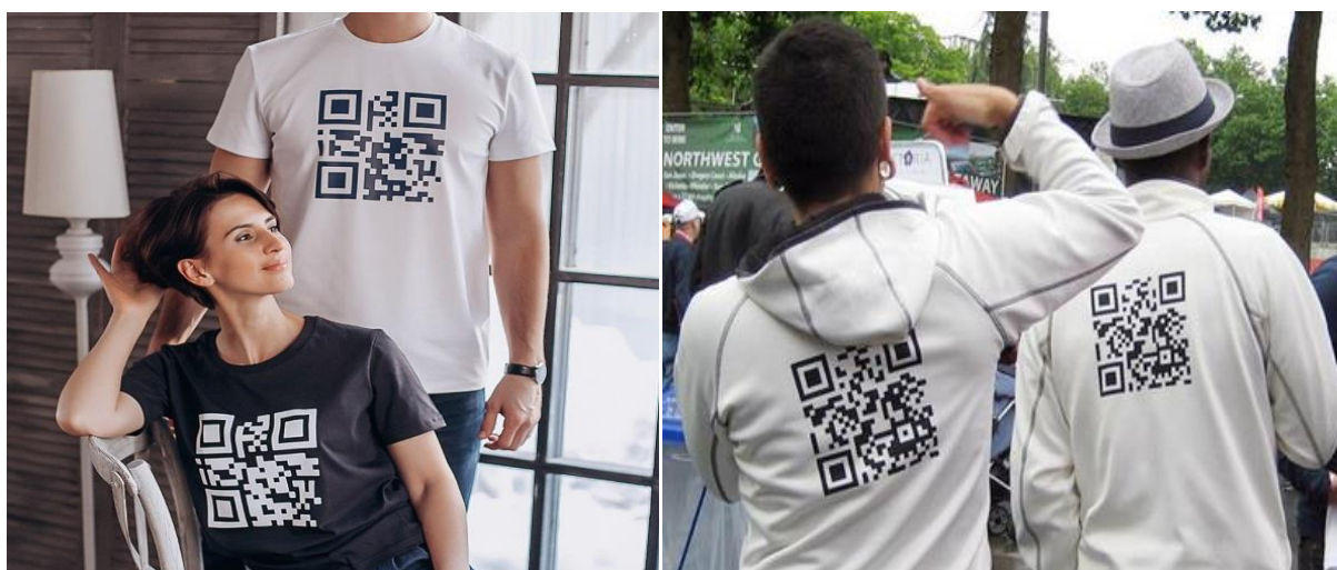
Рис. 2. Використання мотивів QR-кодів в корпоративному одязі

Серед закоханих пар зараз у тренді парні футболки з QR-кодом. На них вони можуть зашифрувати ім'я та зображення коханої людини, фото з відпочинку або будь-яку важливу для них інформацію чи подію. Такі подарунки є зворушливим та сучасними [5]. Їх використовують на весіллях, річницях тощо. Також на футболки та худі наносять QR-код у закордонних навчальних закладах, фірмах, організаціях та інших організаціях. Так вони спонукають до знайомства та дружби у соціальних мережах своїх студентів чи співробітників, а особливо новачків, які опинились у новому світі, рис. 2.