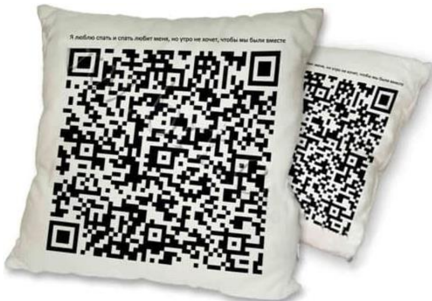
Рис. 3. Нанесення мотивів QR-кодів на домашній текстиль

такі подарунки одиничні та не мають особливої популярності, рис. 3.