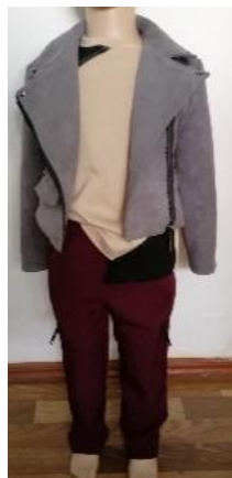
Ансамбль № 2