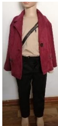
Ансамбль № 3