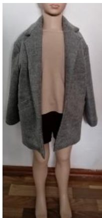
Ансамбль № 1

Надихнувшись результатами дослідження, сучасними напрямками моди та поєднавши дорослу моду із дитячими речами створено колекцію під девізом « Moda par udulte (мода по дорослому) ». Колекція складається із двох ансамблів для хлопчиків та трьох ансамблів для дівчат віком 5-6 років (рис. 1).