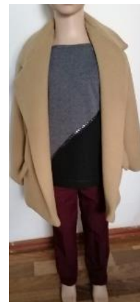
Ансамбль № 4