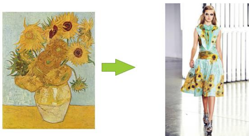
Рис. 3. Модель одягу американського бренду Rodarte за мотивами картини «Соняшники» Вінсента ван Гога

Нідерландський художник, постімпресіоніст Вінсент ван Гог у 1888 році створив картину «Соняшники» [3] (рис. 3). Відомо, що Ван-Гог писав соняшники одинадцять разів. «У кожного художника є свої улюблені квіти», говорив митець. Картина виконана в техніці «імпасто», для якої характерне нанесення фарби дуже густим шаром. В моделях колекції американського бренду Rodarte відтворена кольорова гамма картини, причому в кількох варіантах, як і в оригінальних роботах художника (на теплом та холодному фоні). Також, у сукнях використані принти із зображенням соняшників.