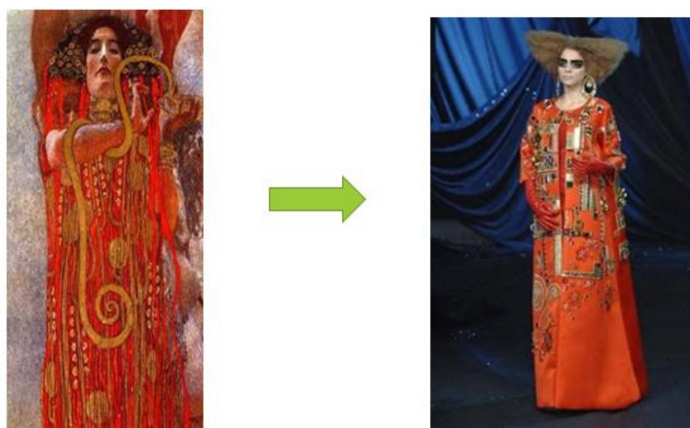
Рис. 1. Модель Джона Гальяно за мотивами картини Густава Клімта «Медицина»

На рис. 1 представлена картина Густава Клімта «Медицина», яка була створена у золотий період в творчості Клімта. Полотно виконане у різних відтінках золотого, крім того, застосовувалося сусальне золото. Стиль - «Ар нуво». Картина насичена стилізованими рослинними елементами. Композиція вертикальна. Alegoria здоров'я – богиня Гігієя, зайняла центральне місце у композиції. За мотивами цієї картини дизайнер Джон Гальяно у 2008 році створив колекцію одягу [2]. Як видно із моделі колекції, форма сукні повторює форму одягу на картині і відображає дух епохи. Дизайнер передає повністю образ жінки (макіяж, зачіска), яка зображена на картині. Колорит та орнаментальні елементи повністю відповідають колориту картини. Таким чином, тут спостерігається, прийом практичного цілого перенесення образу з картини на одяг, звичайно, із елементами стилізації.