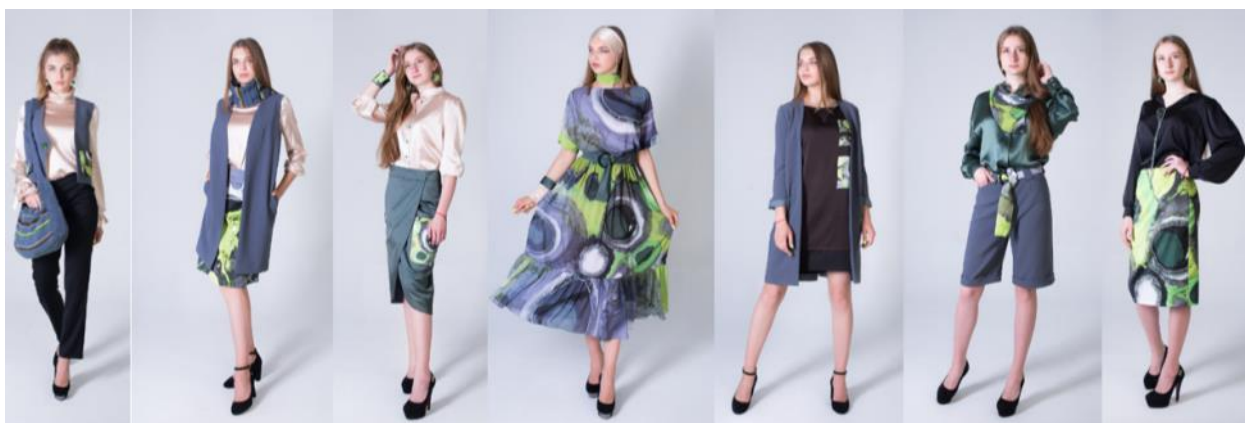
Рис. 7. Ескізний проект та колекція жіночого одягу «Зародження планет» (автор Світлана Мельничук)