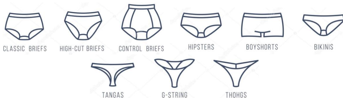
Рис. 1. Модельні типи сучасної чоловічої білизни

Провідні світові бренди пропонують велику різноманітність моделей чоловічих трусів [1, 2], які анітрохи не поступаються жіночим. Існує повсякденна, безшовна, спортивна, коригуюча, термозахисна і еротична чоловіча білизна. Зовнішній вигляд сучасних форм поясної групи чоловічої натільної білизни наведений на рис. 1.