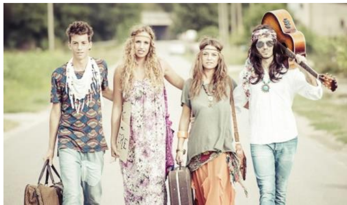
Рис.2. Хіпі – перші, хто використав еkleктичний стиль в одязі

Першими, хто почав використовувати еkleктику в одязі були хіпі. Їх філософія та концепція життя вимагала певного вираження своїх поглядів в одязі. «Діти квітів» виступали за мир в усьому світі і вираження любові до нього (рис.2). Яскраві кольори в одязі сильно виділялись на фоні загальної маси. В їхньому випадку еkleктика стала своєрідним інструментом протесту суспільним стереотипам, способу життя та мисленню, які вважали еkleктичний стиль проявом несмаку та інакодумства, і цей стиль надав течії хіпі епатажності. Оригінальність, практичність та невичерпне комбінування елементів одягу зробило цей стиль актуальним. Тепер можна було сміливо поєднувати шкіру та шовк, жакети та джинси, ніжність та агресивність.