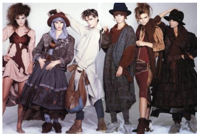
Рис. 3. Колекція британської дизайнерки Вів'єн Вествуд «Buffalo Girls», 1982 р.

Еkleктика супроводжувала стилі вісімдесятих років ХХ століття. В цей період змішались жіночність і мужність, утворивши стиль «унісекс», мілітаризм жіночих костюмів поєднали з романтичністю, а рок «приправили» гламуром. У цих стилях також прослідковувалася яскраво виражена еkleктична складова. Особливу увагу можна приділити британській дизайнерці Вів'єн Вествуд, яка у вісімдесятих роках показала світу моделі одягу, які поєднували у собі елементи історичного костюму і сучасних, на той час, модних стильових тенденцій. Наприклад, у її колекції «Buffalo Girls» 1982 року (рис.3) дизайнерка сміливо поєднала довгі і пишні спідниці з куртками спортивного типу, а також форму історичного жіночого взуття з сукнею сучасної в'язки.