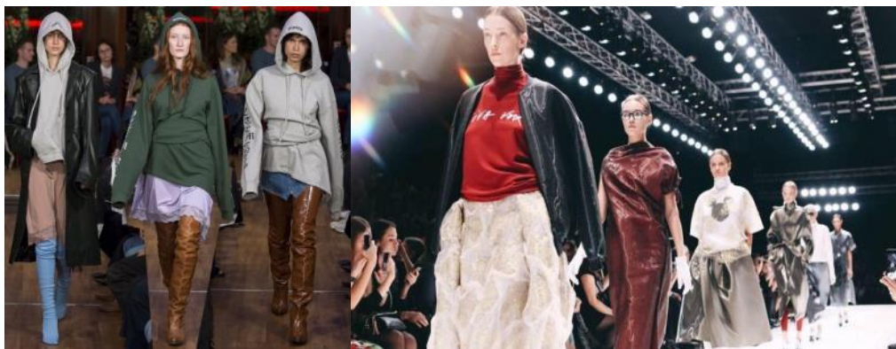
Рис. 1. Приклад еkleктичних прийомів у сучасній індустрії моди

Отже, у ХХ столітті відбулось те, що вважалось неможливим. Не дизайнери зі своїми колекціями диктували, що носити людям, а люди дизайнерам. Street Style захопив більшу частину суспільства, тому дизайнерам не залишалось нічого іншого, як перенести вуличну моду на подіуми (рис. 1) [2].