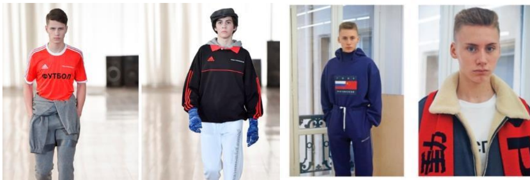
Рис. 4. Еkleктика 90-х років ХХ століття

Різноманітність модних трендів дифузно впливала на мейнстрім, який створював з них нестандартні суміші. Це стало поштовхом для створення нових ідей і концепцій. Наприкінці ХХ ст. стрімко почала розвиватись концепція постмодерну, яка найповніше проявилась у дев'яностих роках (рис. 4). Одним із головних векторів розвитку суспільного життя цих років стала еkleктика, яка була спрямована на відображення дійсності у виборі одягу народними масами, створення нової естетики, пошуку найвдаліших поєднань різних стилів. Така концепція привела до того, що дизайнери епохи постмодерну почали активніше змішувати різні стилі, інколи ризикуючи опинитись на грані несмаку [3].