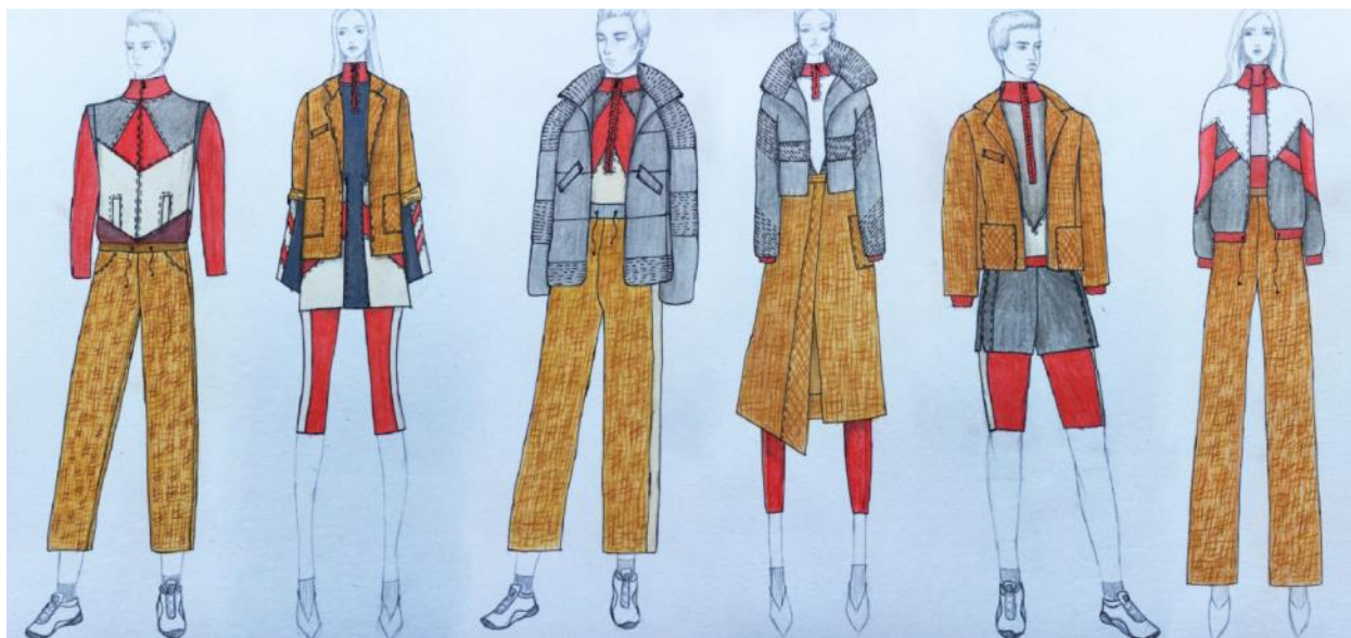
Рис. 7. Ескіз колекції одягу «Вони» (автор А.Кукурудзяк)

Колекцію було представлено на Всеукраїнському фестивалі молодих дизайнерів одягу «Барви Поділля» (м. Хмельницький, 2019 р.), де вона зайняла III місце.