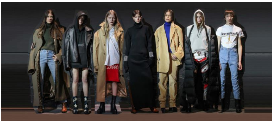
Рис. 5. Еkleктична гармонія сучасного одягу

Поєднувати непоєднуване – це основа еkleктичного стилю в одязі. Хоча, багато хто вважає, що цей напрямок моди є дисбалансом в образі, але це зовсім не так. Еkleктика – це добре продуманий образ, який поєднує у собі кілька стилів одночасно (рис. 5).