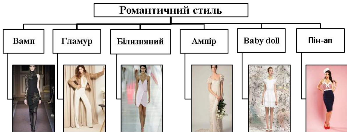
Рис. 1. Основні підстилі романтичного стилю

Аналіз романтичного стилю показав, що він надзвичайно багатогранний. Різновидами сучасного романтичного стилю є стиль вамп, гламур, білизняний, ампір, «baby doll», пін-ап.