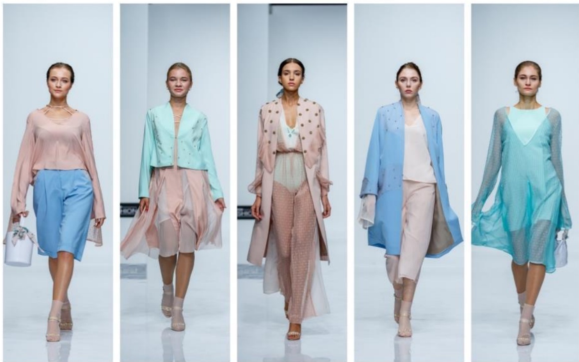
Рис. 3. Авторська колекція одягу у романтичному стилі

Розроблений класифікатор став основою при створенні колекції жіночого одягу в романтичному стилі під назвою «BLOOM» (рис. 3), шляхом вибору тих конструктивно-композиційних елементів, які на даний період часу є актуальними.