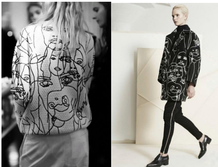
Рис. 2. Використання графіки в оздобленні одягу

Саме через ці особливості графіки дизайнери одягу надають перевагу саме контурному малюнку на виробках своїх колекцій. Черпати натхнення з графіки є цілком логічним в наш час, бо сьогодні в моді простота, лаконічність, стриманість і загадковість.