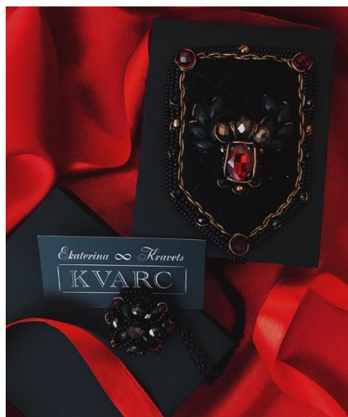
Рис. 2. Логотип авторського бренду “KVARC” напрямку хендмейд