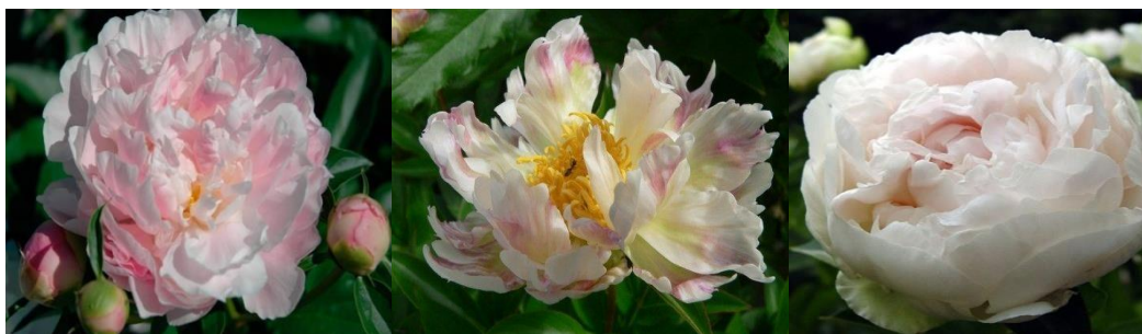
Рис. 1. Фото джерела натхнення – квітки півон

Виходячи з модних тенденцій 2018 року, було створено колекцію жіночого одягу під девізом «BLOOM». Джерелом натхнення для даної колекції було обрано квітку півон (рис. 1).