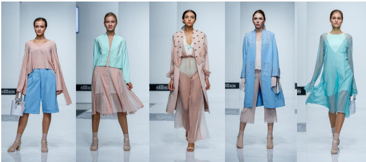
Рис. 3. Моделі колекції «BLOOM»

Основним завданням при створення колекції було збереження образно-асоціативного зв'язку нових моделей одягу з джерелом. Тому в колекції використано плавність і текучість силуетів, фактура тканин, яка нагадує поверхню пелюсток квітки, ніжно-світла кольорова гамма. В сукнях конструктивно закладено об'ємну форму, яка асоціюється з формою бутонів та багат шаровістю джерела (рис. 3).