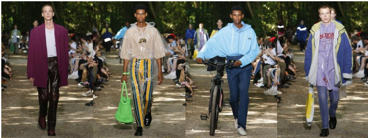
Рис. 3. Колекція чоловічого одягу, Balenciaga

Розглядаючи еkleктичний стиль, не можна оминати колекцію чоловічого одягу весни 2018 року від Balenciaga [5]. Великі старі анораки, сорочки в «гавайському» стилі, піджаки були сконструйовані, ніби речі з 80-х років минулого століття. В таких поєднаннях чудово проглядався еkleктичний стиль (рис. 3).