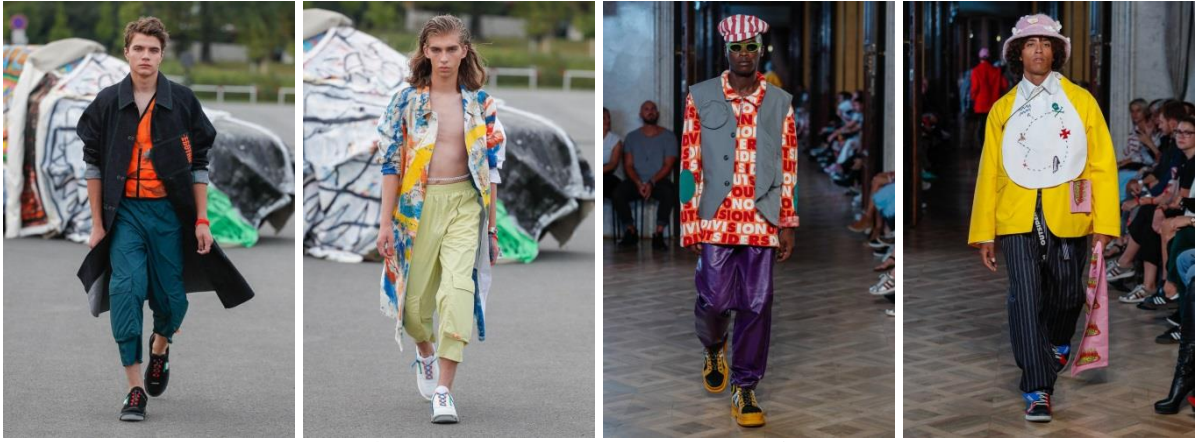
Рис. 4. Mercedes-Benz Prague Fashion Week

Проаналізувавши еkleктичний стиль та модні тенденції останніх та майбутніх сезонів, можна сказати, що це один з найбільш актуальних, але в той же час і складних стилів і, беззаперечно, є цікавим джерелом творчості для створення авторської колекції одягу.