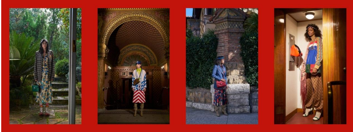
Рис. 2. Колекція Gucci Pre-Fall 2018

Pre-Fall 2018 [4], в якій досить чітко підкреслюється найвища еkleктичність образів у поєднання романтичного стилю з спортивним чи з класичним (рис. 2).