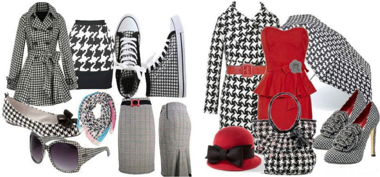
Рис.2. «Гусяча лапка» в сучасному гардеробі

«Гусячі лапки» дозволяють «грати» з кольором, відходячи від класичного чорно-білого варіанту, а також з розміром клітини. Іноді вона може бути ледь помітна, зливаючись в сірий колір, а інколи досягати неймовірних розмірів (рис 2).