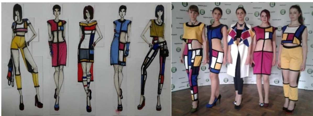
Рис. 3. Ескіз та моделі колекції «Шляхом Мондріана»

За мотивами творчості знаменитого художника створено авторську колекцію «Шляхом Мондріана» (рис. 3).