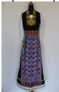
Рис. 1. Национальный женский сарафан из региона Елхово-1930 г.

На протяжении веков люди вырабатывали и носили одежду, которая была типичной для их предков. Традиционные народные костюмы болгар отличаются чрезвычайным богатством и многообразием. Они являются результатом различных географических, исторических и культурных условий, в которых живут люди. Таким образом, на основе миграции и демографических изменений, формировались и основные виды женских костюмов: Елховские, Верхне-тракийские, нижне-тракийские и т.п. Люди, живущие в разных регионах, вырабатывали одежду характерным образом. Судя по специфике отдельных элементов, можно получить информацию о социальном статусе и месте жительства человека, который носит одежду. Художественное оформление костюмов показывает богатую духовность, творчество и страсть к красоте, характерные для болгарского народа.