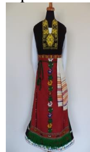
Рис. 2. Национальный женский сарафан из региона Елхово-1950 г.