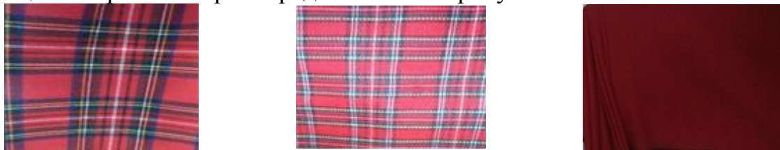
Рис. 2. Образцы основных материалов верха для проектируемых национальных костюмов «Кряшен»

Оптимально подобран пакет материалов для изготовления костюма, образцы материалов верха представлены на рисунке 2.