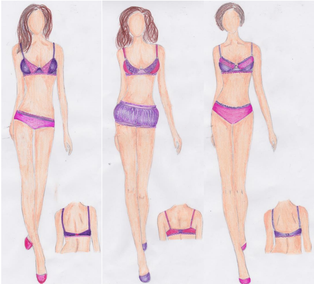
Рис. 2. Ескізи моделей промислової колекції бюстгальтерів

Отже, в результаті дослідження була отримана інформація щодо найбільш популярних серед жіночого населення молодшої вікової групи композиційно-конструктивних ознак бюстгальтерів, яка використана для розробки колекції сучасних моделей (рис. 2).