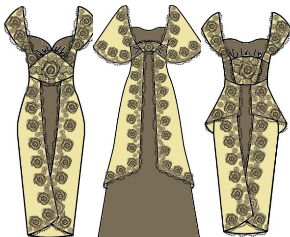
Рис. 2 –Фрагмент колекції жіночих суконь під девізом «Labelle»

Підтвердженням цьому є розробка ескізного проекту авторської колекції під девізом «Labelle», яка побудована на комбінаторній групі № 3. В розробленій колекції, використано принципи подібності, цитат, аналогій і спрощення. Стилізації підлягає крій рукава, перетворюючись з суцільновикроєного на рукав «крильце». Форма декольте змінюється з прямокутної на фігурну. Довжина виробу – вкорочується, за зразком верхніх шарів багат шарових спідниць.