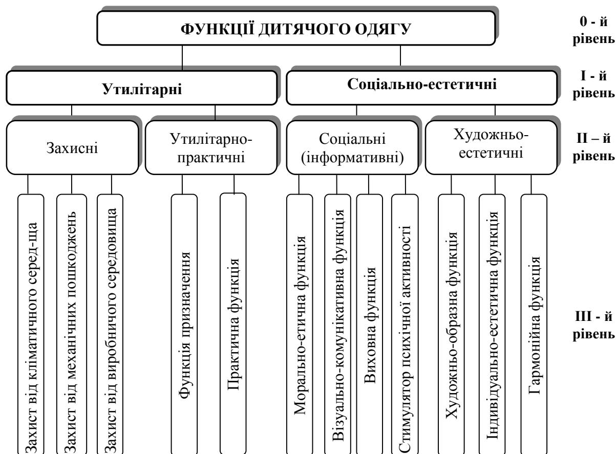
Рис. 2 – Функції дитячого одягу

Аналіз літературних джерел дозволив визначити функції дитячого одягу, які детально викладені на рисунку 2.